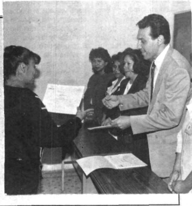
Momentos en que se lleva a cabo la entrega de reconocimientos a las enfermeras por parte de autoridades académicas de la escuela de enfermería de la UPAEP.

¡PIENSA EN TU FUTURO! ¡PROTEGETE! PROGRAMA DE SOLIDARIDAD (PARA APOYO EN CASO DE FALLECIMIENTO DEL PADRE O TUTOR) INSCRIPCIONES DEPARTAMENTO DE TESORERIA INFORMES DEPARTAMENTO DE BECAS