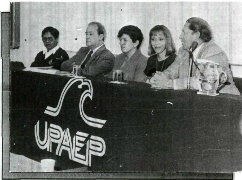
La UPAEP se incorporó a la Red Mexicana de Información y Documentación en Educación (REDMEX), mediante la intervención del Centro de Investigación y Asesoría Pedagógica de la UPAEP.

Para concluir, señaló "y si alguien tiene que ser el primero en sacrificarse en las condiciones en las que todos pagamos muy serios resultados de esta confrontación, tiene que ser el gobierno".