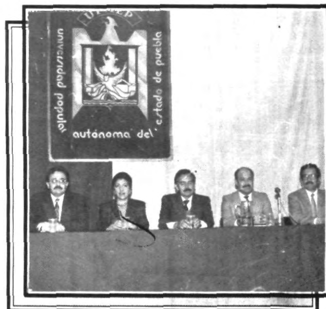
La División Tecnológica de esta casa de estudios, realizó una asamblea general con alumnos de las diferentes ingenierías, para dar a conocer los avances y programas de trabajo que se van a llevar a cabo durante el periodo de primavera que ha comenzado.

Al referirse a la clínica de Odontología con cuenta la UPAEP, manifestó que está al servicio de la comunidad poblana y que de forma solidaria ofrece servicios odontológicos a precios módicos para todas aquellas personas que no pueden solicitar los servicios de un dentista particular para su atención, por lo que dijo que pueden acudir a dicha clínica para recibir la atención correspondiente.