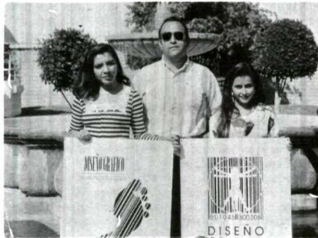
Alumnas en compañía de su profesor, galardonadas en el concurso de carteles realizado en el V Encuentro Nacional y Primero Internacional de escuelas de Diseño Gráfico con sede en la ciudad de Querétaro.