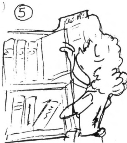
5.- Visita la biblioteca, el acervo actual es muy amplio y te servira para incrementar tus conocimientos, no te quedes solo con tus apuntes.