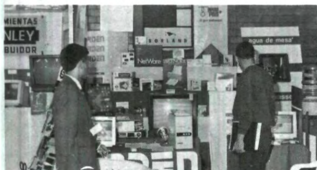
La escuela de Sistemas Computacionales llevó a cabo su 1ra. Expo-Informática Empresarial UPAEP, 94

Recuerda sólo es transitorio, tienes sólo tres oportunidades en el tiempo que dura el mismo para acreditar el mismo número de asignaturas. No son tres oportunidades por materia ni por semestre, son sólo tres oportunidades en el tiempo que dilate la medida, y en tres asignaturas distintas. Hasta aquí la información.