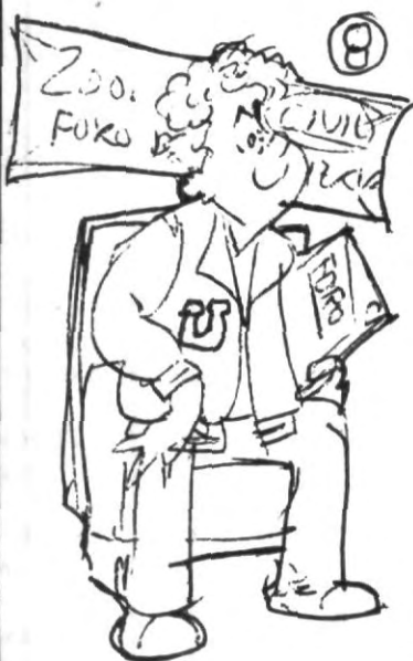
9.- Organiza tu material de estudio, apuntes, libros, etc. fotocopias, notas técnicas, debe estar siempre en orden, completo, consérvalo ya que te será siempre útil.