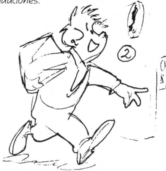
2.- Asiste puntualmente a clases, con el deseo de aprender en cada una de ellas algo nuevo, aún más participa en clase, pregunta, comenta, analiza, discute los temas, no te quedes sentado.