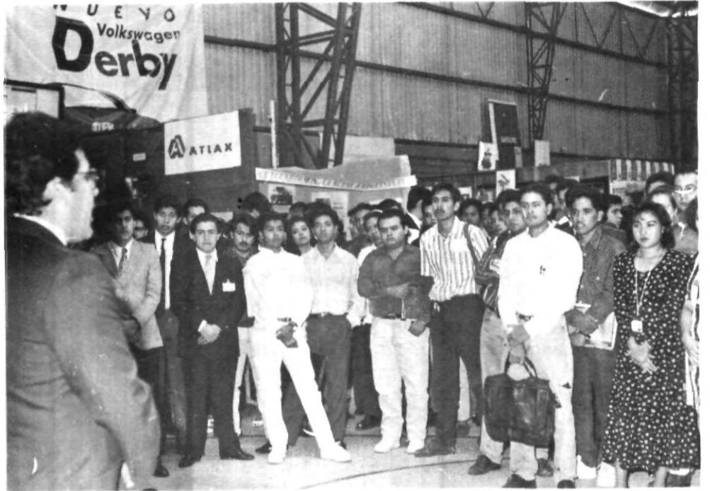
Gran éxito tuvo la Primera Expo-informática Empresarial UPAEP 94, que se realizó en el gimnasio de nuestra Universidad, donde la gente participó con mucho entusiasmo y dedicación.

Día de Colecta: Miércoles 23 de Noviembre. Lugar: Fuente de la Universidad, edificio Central, 21 sur 1103. Hora: De 9:00-14:00 y de 16:00 a 20:00 hrs.