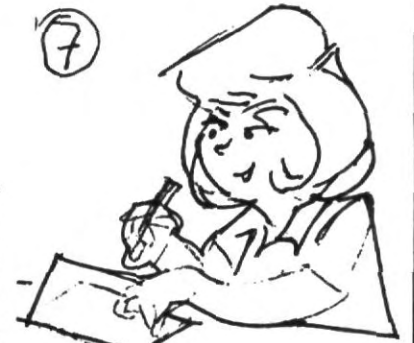
7.- Revisa y autoevalúa tu desempeño para encontrar tus aciertos y limitaciones, tú mejor que nadie sabes en cuáles debes poner mayor empeño, es mejor prevenir que reprobado.