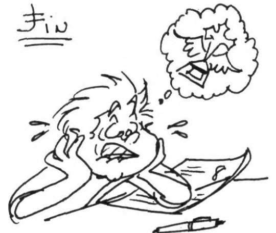
Aguas no pongas esta cara mejor estudia...

8.- Asiste a seminarios, conferencias, congresos y todo tipo de actividades extracurriculares, esto te brindará un panorama más amplio de tu carrera, además encontrarás en ellos más fuentes de motivación imprescindibles para continuar tu carrera con el empuje necesario y concluir con éxito