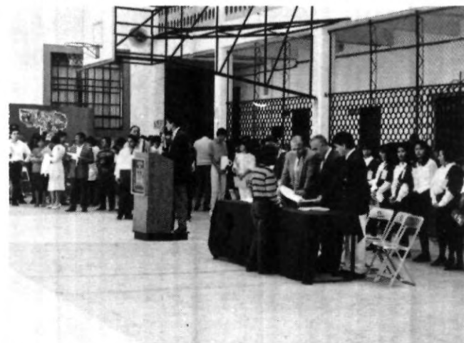
Alumnos recibiendo sus diplomas de reconocimiento por su destacada participación en la IV Olimpiada Estatal de Química.