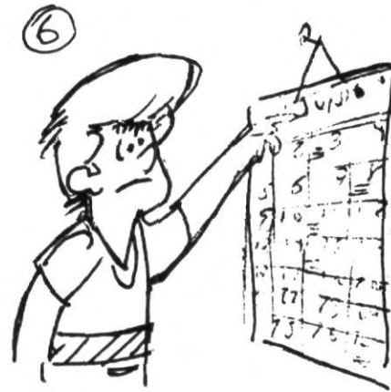
6.- Organízate, programa tus actividades, dando el mejor tiempo del día al estudio y preparación de exámenes, no lo dejes para la noche cuando ya estás cansado y no puedes concentrarte.