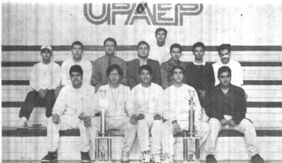
Este es el equipo de Tae-Kwon-Do de la UPAEP que participó en los pasados juegos nacionales de la CONADEIP, quienes por cierto, tuvieron una destacada labor.