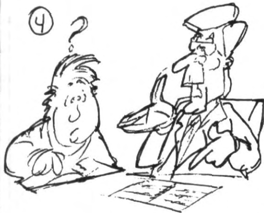
4.- Entrevístate con tus profesores frecuentemente para aclarar dudas y discutir temas de clase.