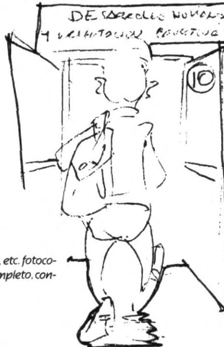
10.- El departamento de desarrollo humano y orientación educativa puede asesorarte en el PROCESO DE AUTOAPRENDIZAJE.