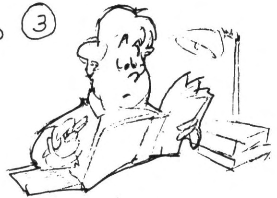
3.- Realiza tus tareas, trabajos, prácticas, etc. con la metodología apropiada y con el entusiasmo necesario para sacar el mayor provecho de ellas.