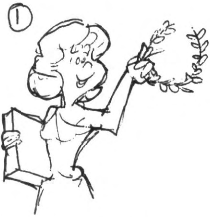
1.- Estudia con el deseo de conocer, amar y difundir la verdad.

Diez es sólo una nota pero representa para ti tus logros del curso (diez u otra calificación) es la valoración de los profesores sobre los resultados del proceso de enseñanza aprendizaje y que te serán de mucha utilidad en tu futuro profesional. Diez Recomendaciones.