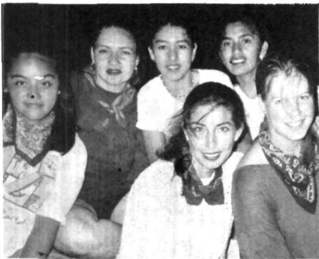
Alumnas de los bachilleratos centro y sur femenino.

Finalmente, en la clausura del campamento se llevó a cabo la premiación de las diferentes patrullas en las que se dividió al grupo. Entre los premios que se entregaron estuvieron: las de orden, de puntualidad y disci-