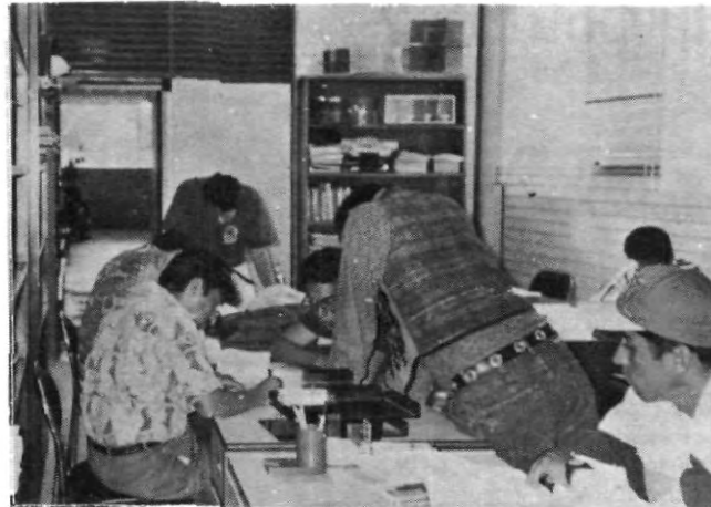
Alumnos de las diferentes carreras han asistido a las asesorías de el Departamento de Matemáticas.

Los Artículos y Mensajes son Responsabilidad del Autor. No son Necesariamente el Sentir de El Universitario.