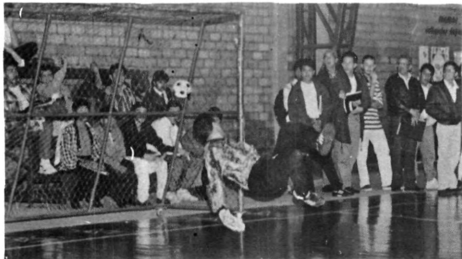
Montañés demostró con hechos que fueron el mejor equipo dentro del torneo interno de futbolito de salón; en segundo lugar, A.C. Milán y con un hombre menos tuvo que aguantar la goliza.