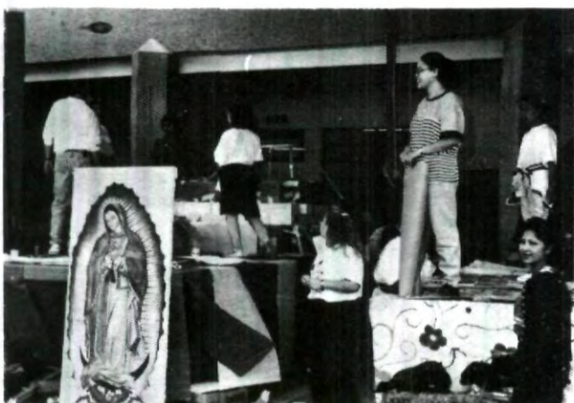
Alumnos Trabajando en los carros alegóricos del "Desfile de las Américas".

Añadió que de Acuerdo a los avances tecnológicos con que se cuenta actualmente, también permiten realizar obras con diversos materiales para la construcción en donde también podría incluirse al adobe como un elemento más para dicha acción.