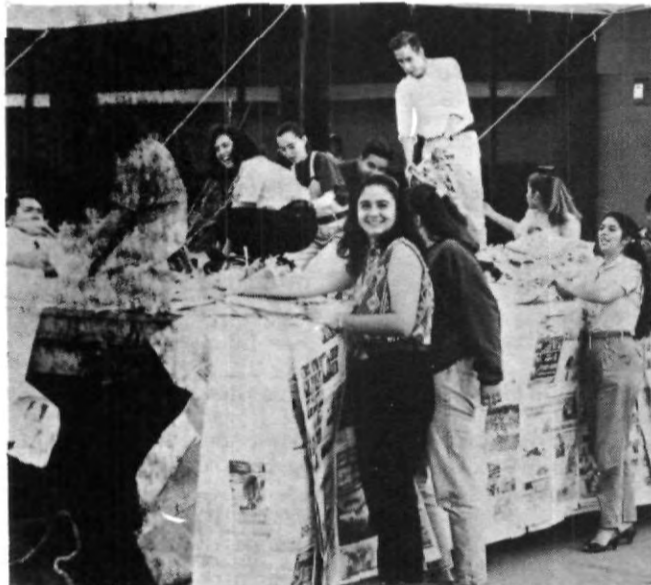
Preparando los carros alegóricos para el "Desfile de las Américas", a realizarse este miércoles 12 de octubre.

Como otros países de América Latina, tenemos problemas que opacan nuestra imagen en el exterior. En nuestro caso hablamos de narcotráfico y guerrilla, que son un fiel reflejo del deterioro social, carencia de valores y la lucha ideológica sin fundamento. Según la Comisión Internacional de Derechos Humanos, tenemos los más altos índices de mortalidad por hechos violentos, una realidad a la cual no podemos volver la cara y más cuando se trata de fuerzas negativas que, día tras día, se filtran en el acontecer de nuestro país. Sin embargo, confiamos en nuestro sistema judicial, en nuestros gobernantes y en nuestra iglesia; creemos en el diálogo y en la esperanza del pueblo que desea un futuro mejor para nuestros hijos.