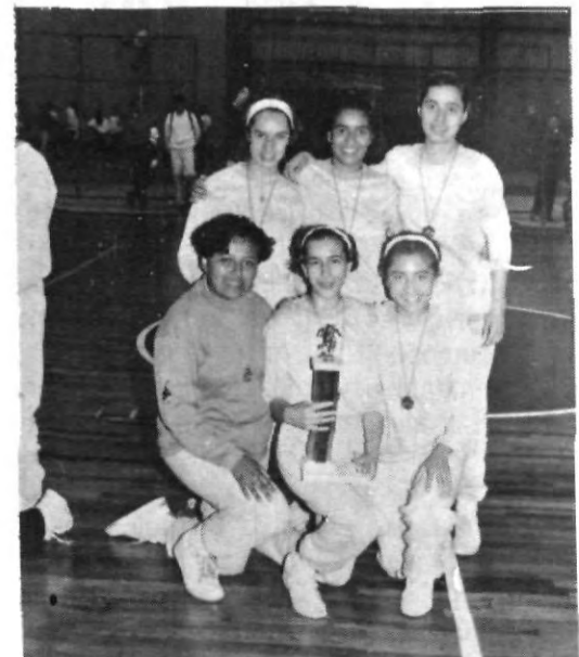
La final entre los dos equipos de Filosofía resultó ser entretenido y emocionante, coronándose Stella Maris y en segundo lugar Stella Polare.

Después de un largo campeonato, Stella Maris y Montañés lograron superar a sus rivales, quienes dieron pelea, pero no consiguieron estar al nivel de los ganadores.