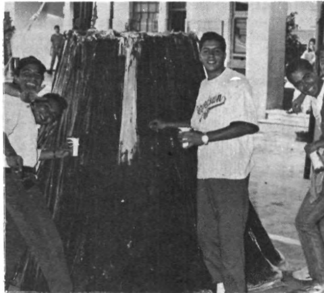
Alumnos de las diferentes escuelas y facultades de la Uni, de manera entusiasta arreglan sus carros alegóricos.