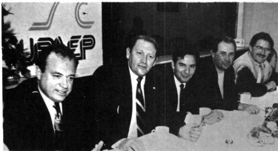
Después de largas conversaciones, el Puebla prestó el estadio Cuauhtémoc.

Finalmente se dijo que en caso de que coincidan los partidos de ambos conjuntos, la UPAEP tendrá que utilizar el Ignacio Zaragoza como casa alterna.