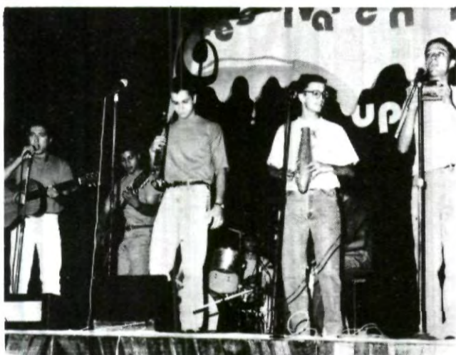
Exito rotundo el XVIII Festival de la Canción UPAEP (información Pag. 6).

Sin embargo abundó que "habría un problema de mediano plazo todavía sin resolver, que sería la sobrevaloración del tipo de cambio y una inflación difícil de controlar debido a este fenómeno."