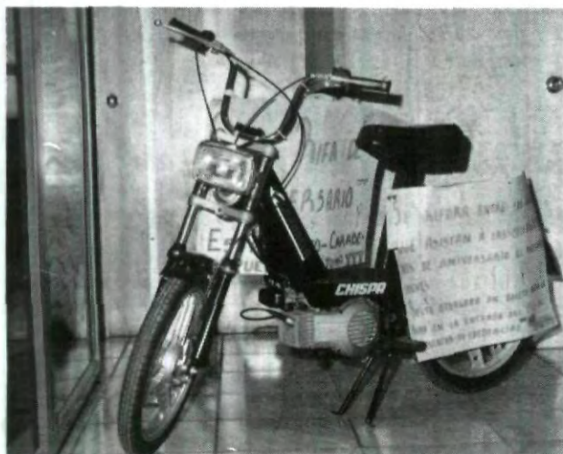
Tu puedes ser el próximo afortunado al ganar esta motoneta, si asistes a los festejos de la Uni en el CIU.

"Ahora, abundo García Teruel, sólo resta que los alumnos que estén al frente del proyecto demuestren con hechos que un proyecto de esta índole tendrá éxito y ojalá existan mucho más proyectos e iniciativas de alumnos de la UPAEP", finalizó.