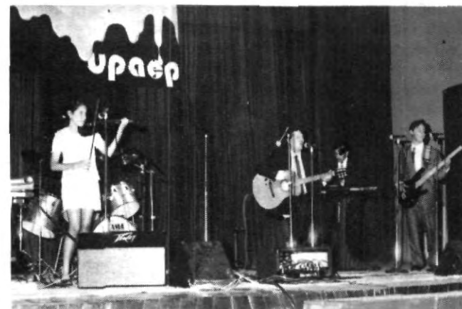
Nutrido número de participantes al XVIII Festival de la Canción UPAEP, se dieron cita en el Auditorio Benavente.