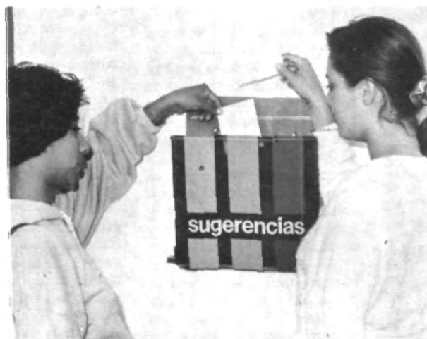
haznos participes de tus inquietudes.

Bien, muy bien por la FEDEST excelente evento, y gran deseo de participación, buenas ideas, haremos más comentarios sobre su trabajo en el próximo número de A OJO DE AGUILA, ahora, sólo me queda nuevamente solicitarles que utilicen el buzón de sugerencias, es un ejercicio positivo para todos los universitarios, hasta la próxima.