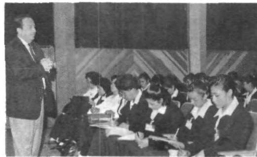
Visita de los estudiantes de enfermería a la Universidad.

°La Federación Estudiantil UPAEP, quiere agradecer al equipo de mantenimiento UPAEP, por su colaboración en la toma de protesta del pasado jueves 14. °También agradecemos al equipo de edecanes y seguridad, aprovechando este medio para felicitarlos por su excelente trabajo. °No queremos omitir los agradecimientos para ninguna persona, y esperamos seguir contando con la colaboración de: el Equipo Audiovisual, el departamento de Relaciones Externas, Asuntos Estudiantiles, Compras, departamento de Comunicación e Imagen y a la comunidad universitaria en general. Atentamente. Fedest-UPAEP.