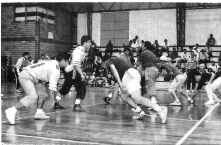
El torneo de tochito ha sido todo un éxito, en la busca del título, los aficionados emocionados observan los aguerridos encuentros.