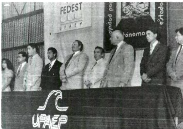
Ante autoridades universitarias, catedráticos y comunidad universitaria, tomaron protesta los integrantes de la Federación de Estudiantes (FEDEST), de esta casa de estudios.