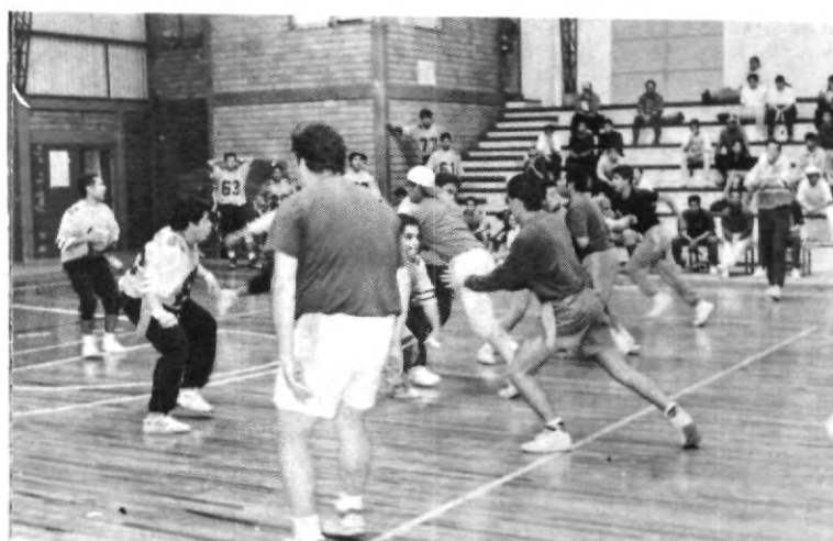
Oye, ¿dónde está la bolita?. Los rivales en busca del balón o del jugador, mientras se organiza la ofensiva.