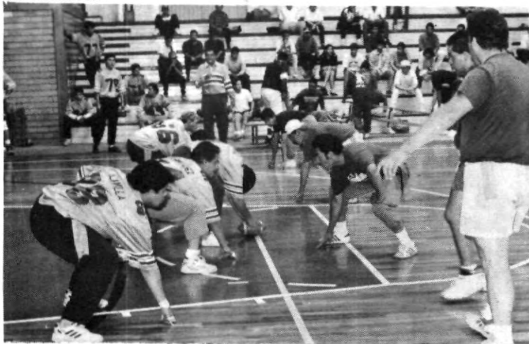
Intenso juego en el nido de las "Aguilas", uno de los jugadores le dice al referi: "Si no viene mi amigo no juego".