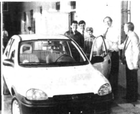
La llegada del Chevy que rifa el Rector, ¡A darle duro a las ventas!