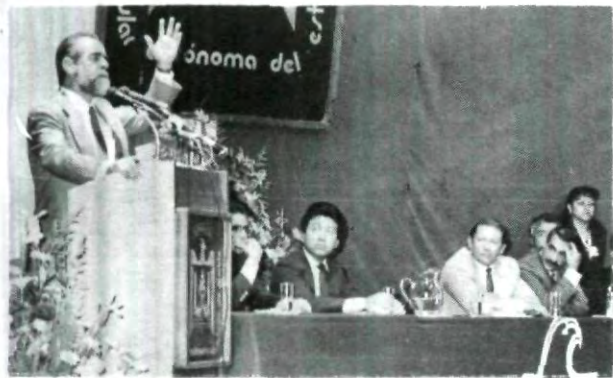
Diego Fernández de Cevallos, del Partido Acción Nacional, presentó su Plataforma Política ante estudiantes de la UPAEP.

Reyes Cervantes, puntualizó que el país atraviesa por graves momentos de crisis, en la cual la verdad parece ser un delito que es pagado por la muerte. Para ello exhortó a la comunidad de la UPAEP, decidirse por el cambio, haciendo de lado apatías y anarquismos, así como no tener miedo de encontrar y defender la verdad.