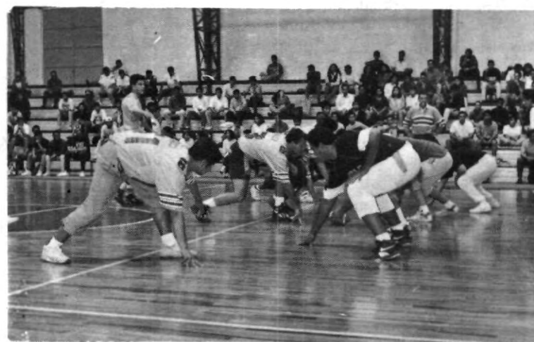
Apoya a tu equipo favorito, a tus cuates. En la gráfica vemos como la afición "se para de sus lugares y anima el partido".