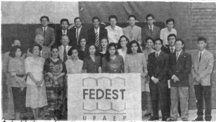
Autoridades universitarias en compañía de los integrantes de la Federación de Estudiantes de la UPAEP.