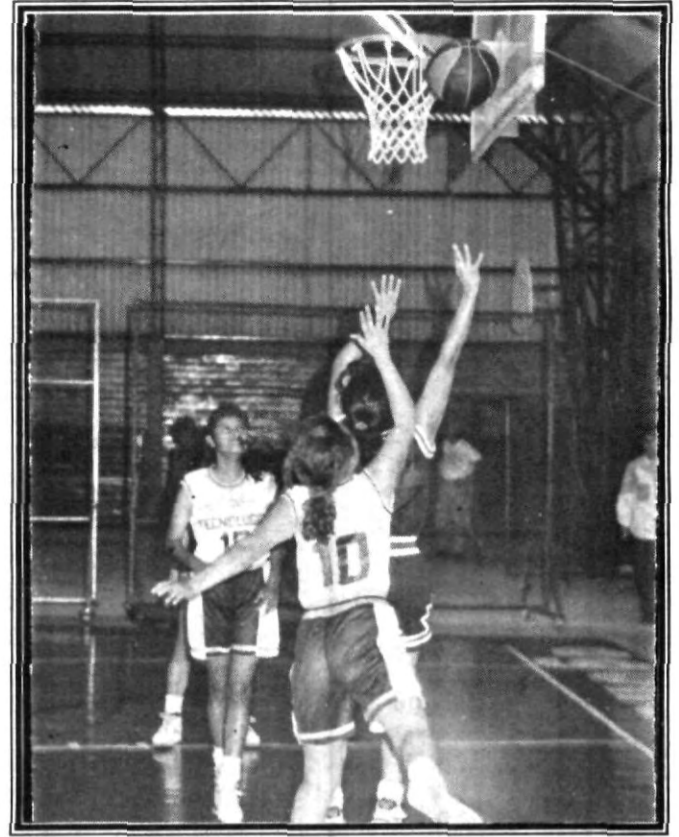
En su último juego de la eliminatoria, las "Aguilas" de la UPAEP vencieron fácilmente a las del Tecnológico de Puebla.