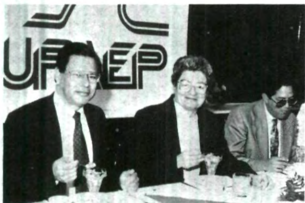
Las reformas económicas que ha realizado Carlos Salinas de Gortari, son las correctas y se deben continuar con el próximo presidente de la república, señaló la doctora Anne O. Krueger, catedrática de la Universidad de Stanford, Estados Unidos.