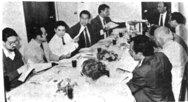
En días pasados se reunieron los integrantes del Consejo Académico de Ingeniería Civil, para la revisión del plan de estudios

Compañero... si maltratas o pierdes un video de la biblioteca. No te preocupes solo tienes que reponerlo, pero la cinta del video debe ser virgen, es decir, totalmente en blanco. No olvides que los videos en servicio externo sólo se prestan por un día, y se se te pasa entregarlo hay un pequeño recargo.