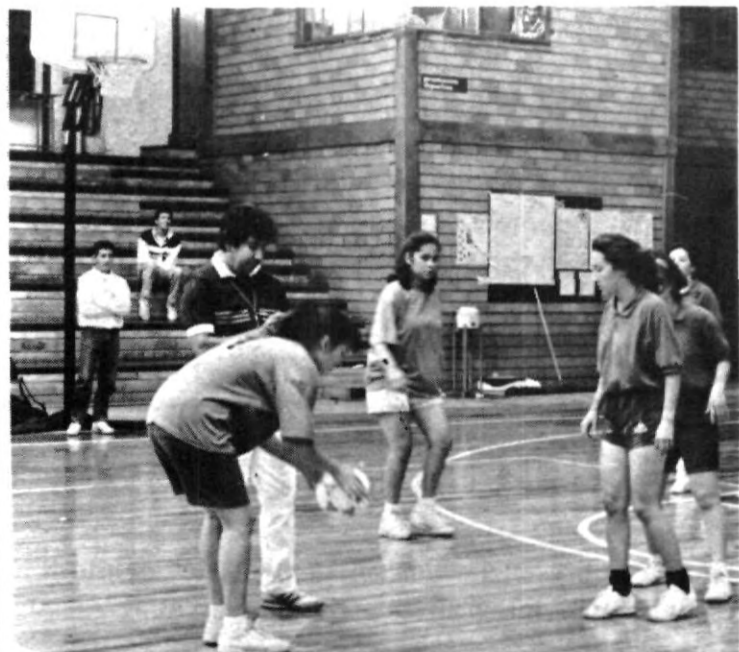
El equipo femenino de fútbol rápido está en esperas de enfrentar sus últimos compromisos para poder asegurar el viaje al regional del CONDDE.

Posteriormente sucumbieron 1-0 con el Tecnológico de Puebla, al igual con la BUAP pero, por goleada de 9 contra 1 y finalmente vencieron a la Normal del Estado por 6 goles contra 3, en un choque con muchas dificultades y roces. Será para el próximo torneo, cuando intente calificar al regional.