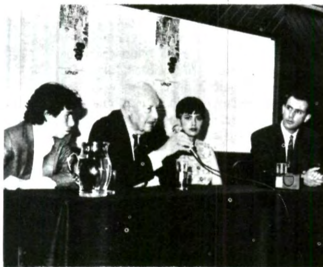
El reconocido cineasta Alfredo Crevenna, durante su conferencia a alumnos de CICOM.

Es así como una vez más la UPAEP, alentada por el espíritu siempre participativo y de donación hacia el prójimo, el cual se ve reflejado en cada una de las acciones de sus alumnos, colabora en este caso en beneficio de los ciudadanos chiapanecos, quienes desde las primeras horas del presente año vienen sufriendo los problemas sociales que ya son del todo conocidos.