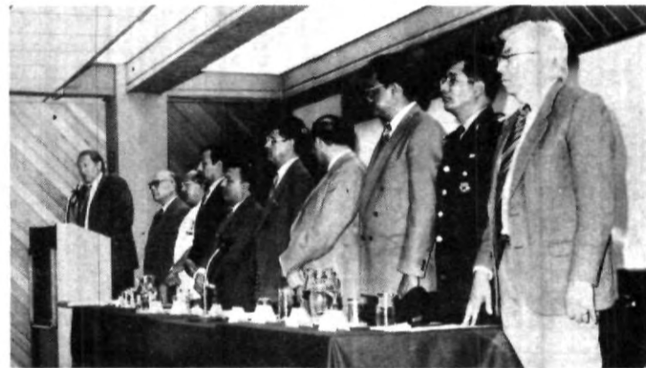
Se llevó a cabo la ceremonia de clausura e iniciación de la Maestría en Salud Pública. Se contó con la asistencia de funcionarios del actual gobierno estatal así como de autoridades de nuestra casa de estudios.

La Muralla China, fue construida para evitar la entrada de los Hunos del norte, estos podían pasar aún por la muralla pero no así sus caballos. Sin estos, los Hunos dejaban de ser un peligro y por lo tanto ya no eran conquistadores efectivos.