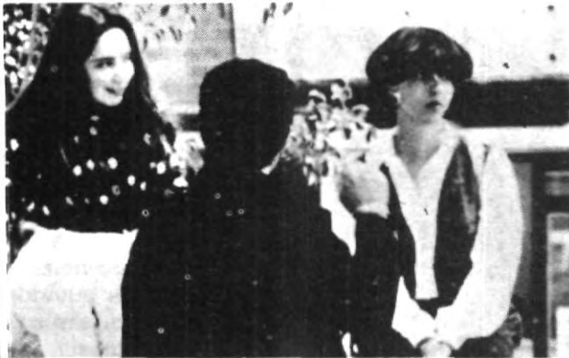
Una imagen dice más que mil palabras. ¿A quién están viendo?