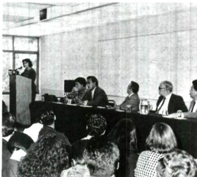
Ante funcionarios y estudiantes de las diferentes escuelas y facultades de nuestra casa de estudios, la candidata a la Presidencia de la República, Cecilia Soto, expuso su plan de trabajo, en caso de ganar las elecciones de agosto próximo.

Por otra parte, la Federación asocia a 61 instituciones de educación particular en un proyecto iniciado en 1983 a través de las diferentes comisiones afiliadas a la Federación. Dicha Federación está conformada por un consejo directivo y una secretaría ejecutiva. También involucran a comisiones conformadas por diferentes miembros de la red afiliada a la institución, coordinados por un representante de grupos de trabajo.