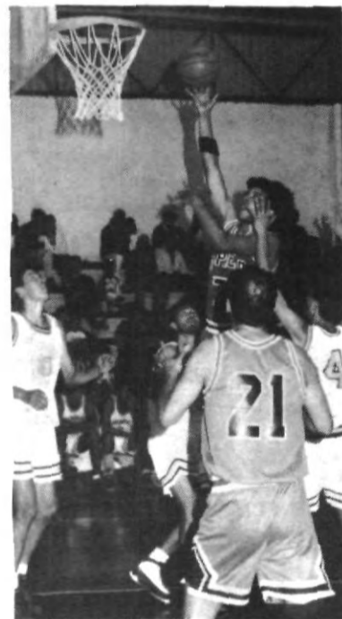
Las "Aguilas" mostraron su poderío ofensivo.