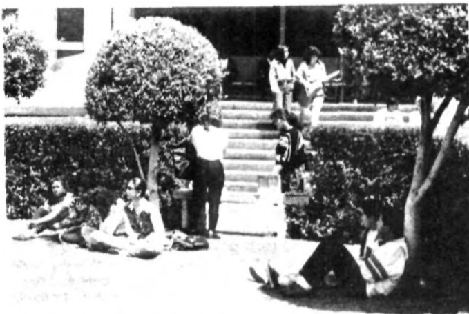
Meditando sobre los exámenes: ¿Habré pasado?