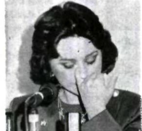
"Pocos mexicanos pensábamos que vivíamos bien."