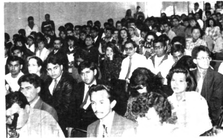
Alumnos de las diferentes escuelas profesionales de nuestra casa de estudios, se dieron cita a la conferencia que ofreció la licenciada Cecilia Soto González, candidata del PT a la Presidencia de la República

El departamento de Tesorería te invita a pagar tus colegiaturas dentro del plazo anteriormente señalado, a conocer su reglamento interno, a utilizar tu credencial, ya que de forma conjunta ofreceremos un servicio de calidad, concluyó.