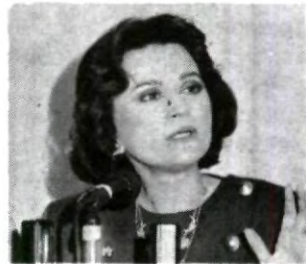
México debe progresar.