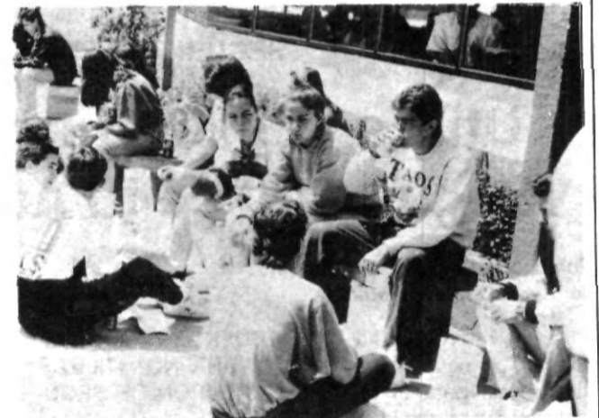
Visita de las Prepas en la Uni.