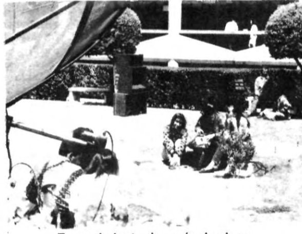
Esparcimiento después de clases.