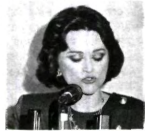
Y de ustedes depende...