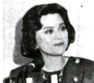
Los chiapanecos marcaron el ;basta! en nuestro país...