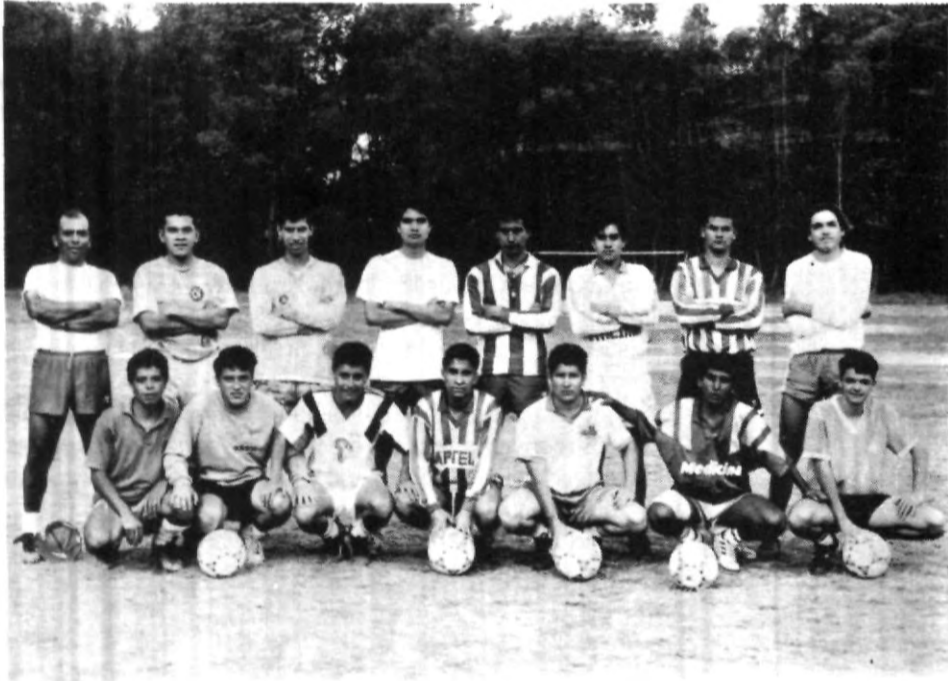
El equipo de fútbol soccer de la UPAEP participará en los próximos juegos estatales del CONDDE, en el nacional CONADEIP y en el Torneo Puebla.