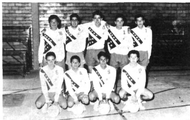
Benavente se coronó campeón de voleibol en la liga pre-universitaria, con un cuadro bien conjuntado y un poderío en las picadas que asombró a todos (arriba). El Instituto México no pudo resistir los servicios de los Lasallistas y sucumbieron en dos sets (abajo).