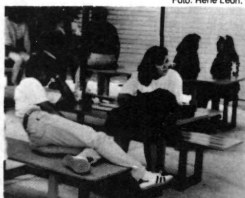
En esta pose tranquila, ¿Estará pensando como pasar su examen?