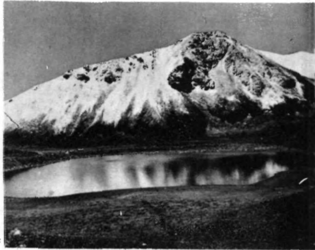
El Nevado de Toluca, un lugar para reflexionar.