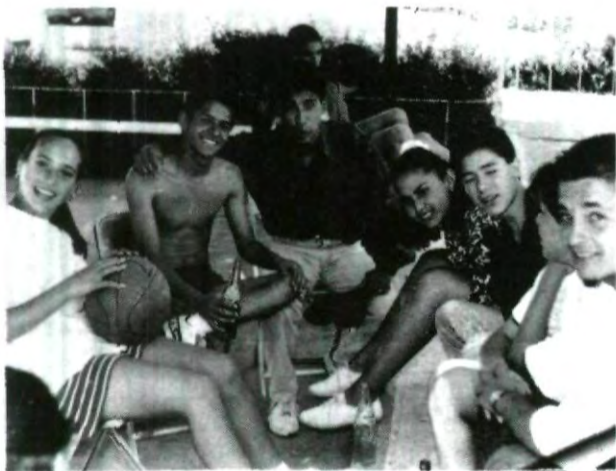
Estudiantes de distintas preparatorias en amena reunión en el CIU de la UPAEP.

Otro aspecto importante es la puesta en funcionamiento de escuelas de verano, aprovechando la diferencia de estructura en los calendarios académicos; de igual manera se editará un anuario interuniversitario iberoamericano, que recoja los aspectos fundamentales de la política educativa de los estados, de la estructura y características fundamentales de las universidades de la red.