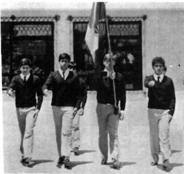
24 de Febrero día de la Bandera Mexicana

Has sido mutilada, hecha jirones, O rasgada en las luchas varias veces,