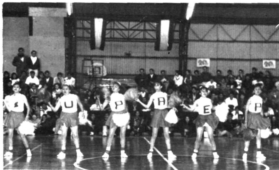
El apoyo a nuestros equipos será fundamental para obtener triunfos, las porristas empezarán a trabajar en ello.

Mientras en esa misma rama los varones también tendrán oportunidad de buscar una aparición decorosa en dichos juegos. Recordemos que en los regionales celebrados en la UNAM, nuestra participación en atletismo varonil pasó desapercibida.