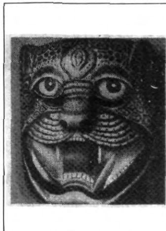
Ven y tómate la foto