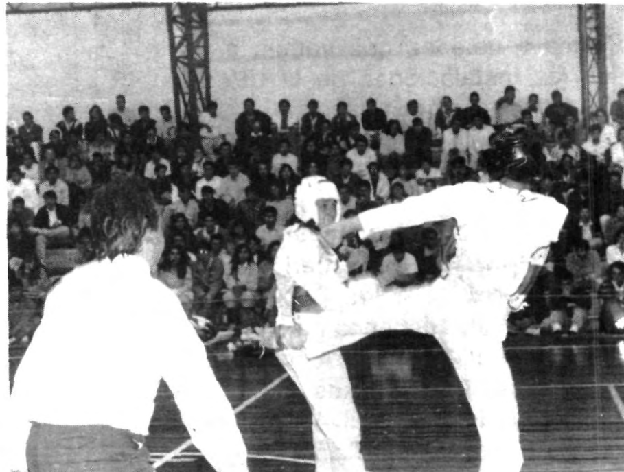
En taekwondo se buscará obtener un buen lugar, actualmente nuestro equipo es campeón de la CONADEIP en la rama femenil y cuarto en varonil.

En fútbol rápido estamos pasando por un momento bueno, tanto en femenil y varonil. En donde hay que trabajar en serio es en el voleibol, pues hace un año, los aguiluchos iniciaron bien pero al llegar a los regionales vieron caer su suerte y con ello nuestro orgullo; ya que sólo ganaron un juego y eso con muchas dificultades.