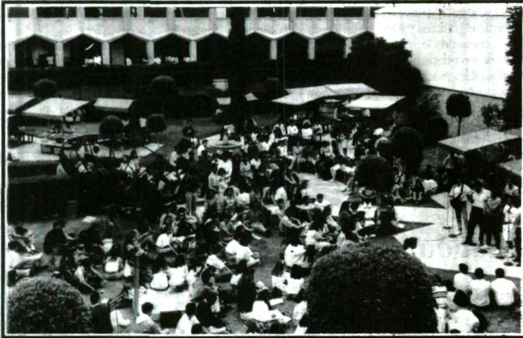
¡ Bienvenidos jóvenes universitarios! 1994, representa un año lleno de retos para todos, por lo tanto hay que echarle todas las ganas para que nos vaya bien en los estudios.

"Nos volvemos a reunir nuevamente, para iniciar un semestre más, para continuar con sus estudios y enfrentar los retos que nos prepara la vida, y más para ustedes jóvenes universitarios, que representan el futuro de nuestro país y la esperanza del mañana".