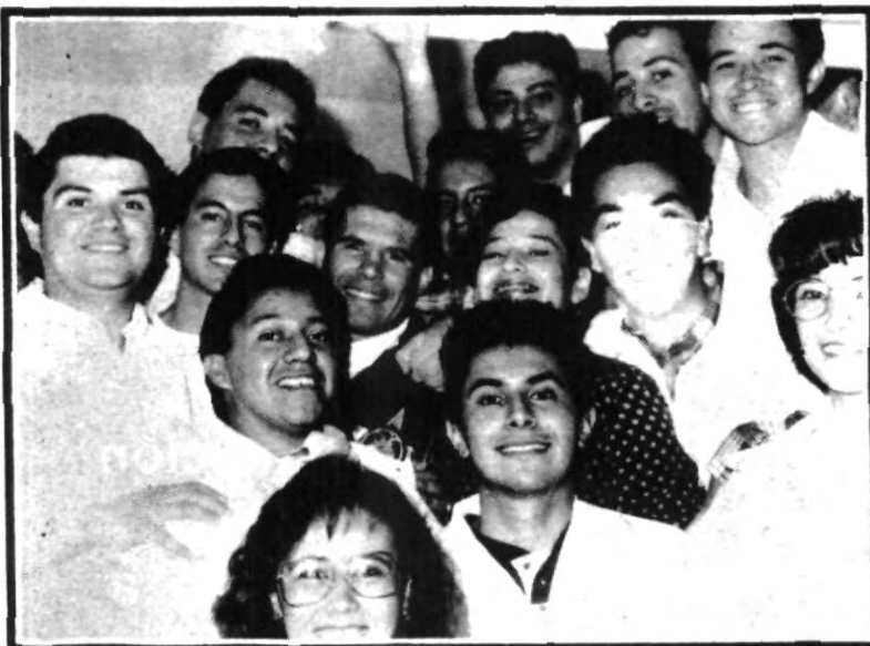
El tricampeón Mundial de Boxeo, Julio Cesar Chávez, estuvo en la Universidad, en la clínica de odontología. Aquí con algunos alumnos.