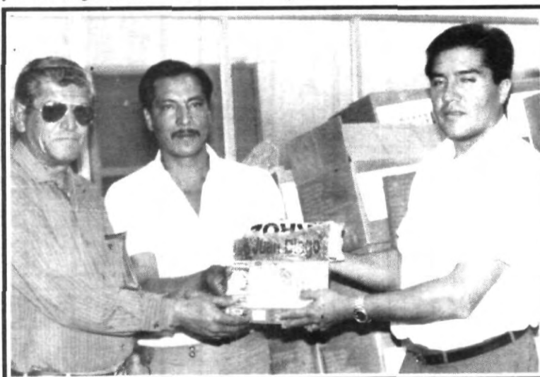
Un total de 10 y media toneladas de alimento básico distribuirá la UPAEP a través del Departamento de Servicio Social, para el programa de Abasto Familiar en las colonias del sur, norte y poniente de la ciudad.