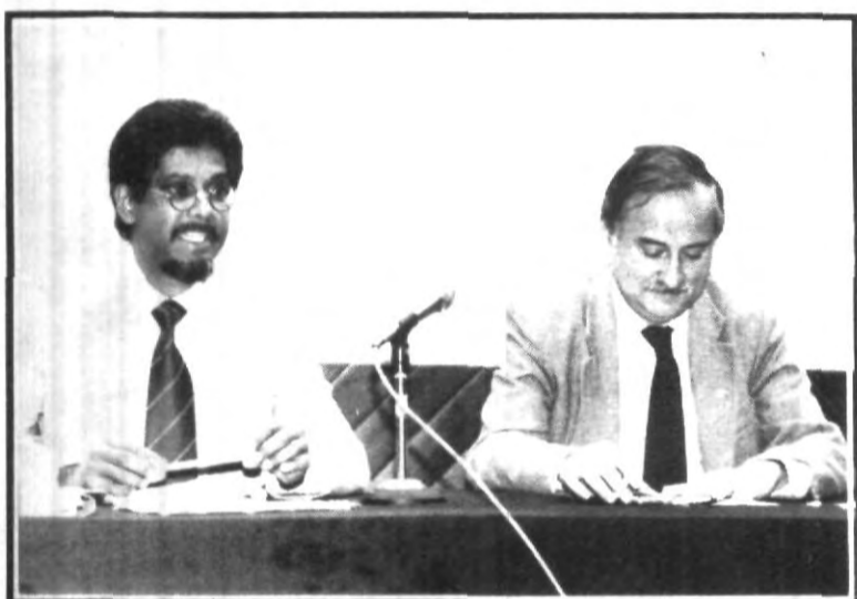
El establecimiento de una moneda única con los Estados Unidos y Canadá, no reducirá las notables diferencias existentes entre esos países, señaló el doctor Anwar Shaikh, al dirigirse a los alumnos de Economía, Administración de Empresas y Contaduría Pública.