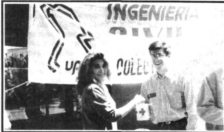
En la mayoría de los cruceros que se asignaron, se distinguió la presencia y participación de la comunidad universitaria, en apoyo a la colecta nacional de la Cruz Roja.