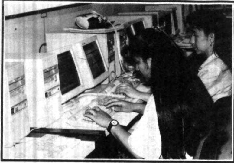
La informática hoy en día ocupa uno de los principales lugares en el campo de la economía a nivel mundial. Donde los Estados Unidos junto con Japón marcan la pauta a seguir.