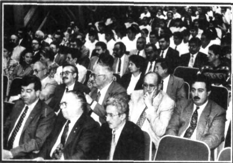
Destacados miembros del sector privado, estuvieron presentes durante la Ceremonia de Reconocimiento a donantes de la UPAEP, que hicieron posible la construcción de la nueva clínica de odontología.