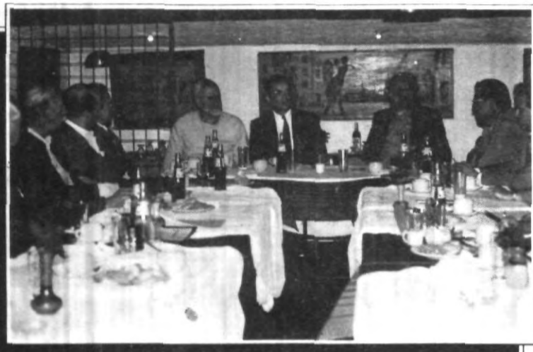
Miembros del Consejo Académico de la Facultad de Arquitectura, durante la reunión que sostuvieron con representantes de la empresa internacional PEI Cobb Freed and Partners.