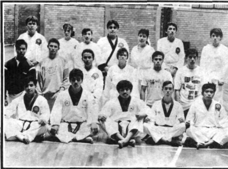
El TAE-KWON-DO, es una de las disciplinas deportivas que te ofrece nuestra Casa de Estudios. Entre otras cuenta también con las de basquetbol, futbol, voleibol y otras más.

Finalmente, destacó que abrán otros eventos tales como basquetbol y voleibol varonil y femenino respectivamente.