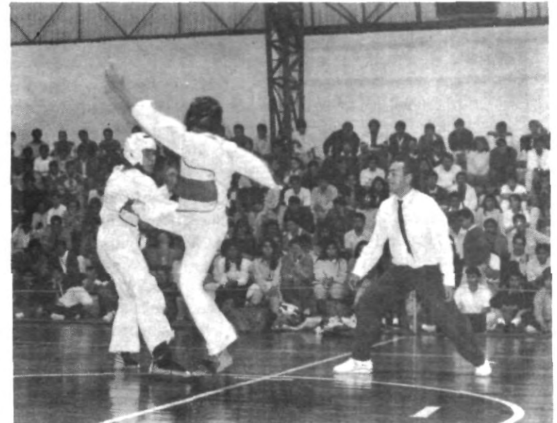
La escuadra de Tae Kwon-Do UPAEP es favorita para obtener el título de campeón Nacional de la especialidad en el torneo que organiza la CONADEIP en las instalaciones de la Universidad de Monterrey