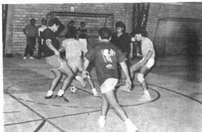
Se acerca el final del Torneo interior de Fútbol de Salón y los partidos se ponen cada vez más reñidos y disputados. Hay que estar pendientes