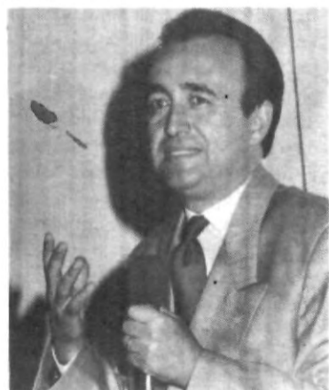
En Comunicaciones no caben las improvisaciones, todo error se verá, oír y leerá