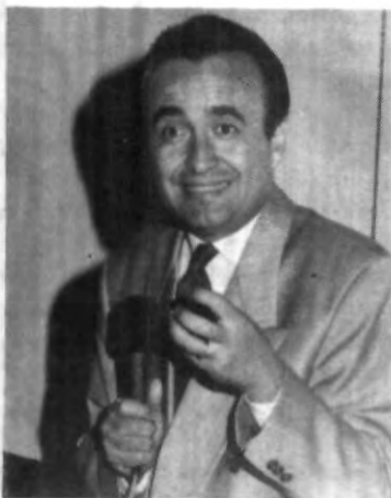
¿Hay por aquí algún familiar de Bartlett?...

Una secuencia gráfica del destacado periodista Pedro Ferriz de Con, durante su participación en el Foro de Ciencias de la Comunicación en conocido hotel de la ciudad.