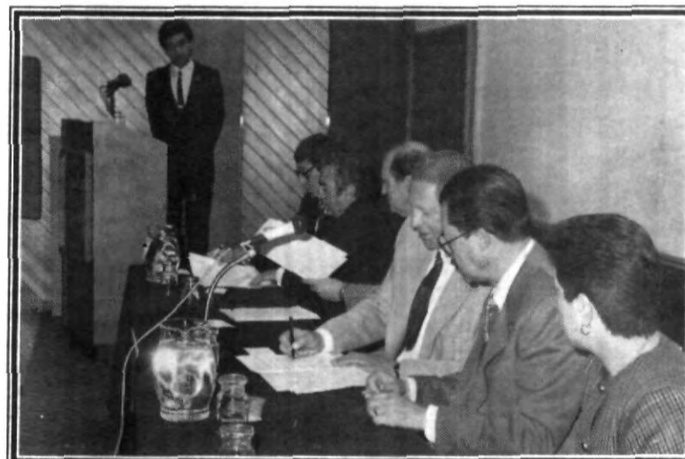
Janssen Farmacéutica y la Escuela de Ingeniería Química, signaron convenio de colaboración en beneficio de los futuros profesionistas de ésta escuela.

Indicó que no se considera suicidio que una persona, que se encuentra en estado crítico rechace tratamientos excesivos que busquen su mejora personal, pero el deber ético y moral de los médicos por defender la vida a veces se cae en excesos, si se toma en cuenta que una persona después de salir de una situación difícil, se encuentra con que ya no tiene determinadas extremidades o partes de su cuerpo, psicológicamente se puede pensar que va a llevar una vida llena de sufrimientos, mejor hubiera sido no recibir ese tratamiento y morir tranquilamente.