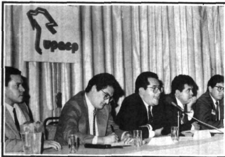
Con éxito terminó el Foro de Ciencias de la Comunicación, que cerró con polémico encuentro entre directores de Noticieros Radiofónicos y alumnos.