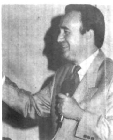
Yo ya recorri todos los canales, sólo me falta el del desague, o no?