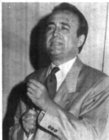
Un país pobre es el que no hace propuestas.