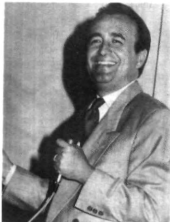
Me lo suponía, no es de Puebla, o no?...