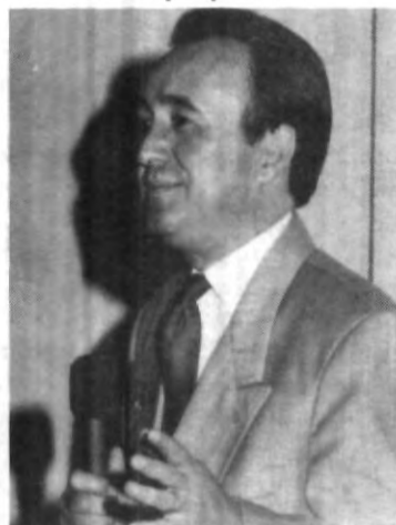
El principal papel de un comunicador es llevar al país al desarrollo vía proposición.