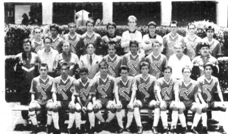
Las autoridades de la Universidad, así como la comunidad universitaria esperan que las Águilas levanten el vuelo en la temporada '92-'93 del futbol de la Tercera División

por bueno se acaba; han pasado 6 años del último campeonato de los Celtics y 4 desde que los Lakers lograron títulos consecutivos. Bird ha tenido que retirarse debido a problemas en la espalda y Magic se va por el hecho de contraer el Virus de Inmunodeficiencia Humana (VIH). Bird manifestó su admiración por su amigo durante la ceremonia en la que fue retirado el número 32 del uniforme de Magic en Los Angeles: "Yo creo que si nosotros hubieramos crecido uno al lado del otro, hubieramos sido inseparables".