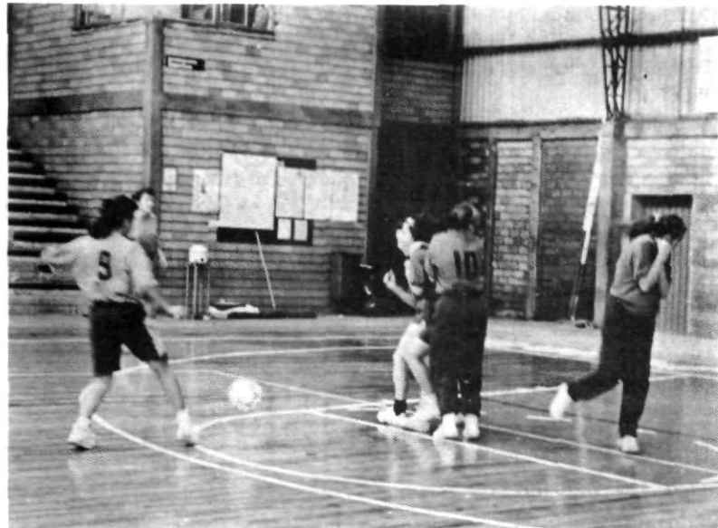
Las escuadras calificadas a las finales del Torneo Interior de Futbol de Salón tendrán su junta previa este lunes en punto de las 18 horas