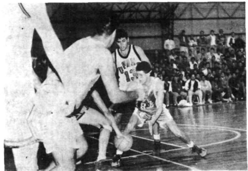
Las Águilas de la UPAEP han conseguido brillantemente su pase a las semifinales dentro de la Liga Nacional de Basquetbol Estudiantil (LINABE)

Ahora, Águilas y Poblanos esperan la hora del inicio de las semifinales como ganadores de la Zona Centro y enfrentarán a los equipos que clasifiquen de la Zona Occidente en una sola sede que como mencionamos será la Universidad Autónoma de Guadalajara.