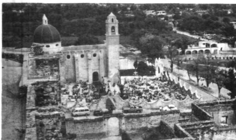
Panorámica del Convento de Cuautinchan, patrimonio de la humanidad.