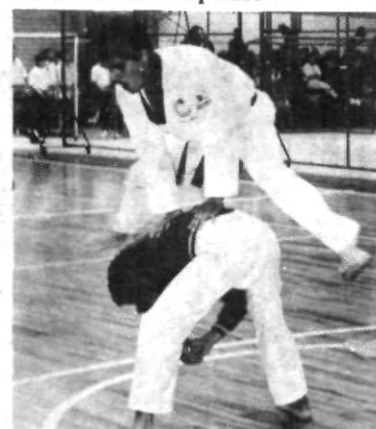
El equipo de Tae Kwon-Do UPAEP se prepara intensamente para el nacional del CONADEIP