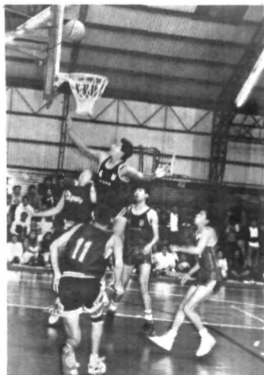
Las Aguilas reciben este miércoles a su tradicional rival la UDLA