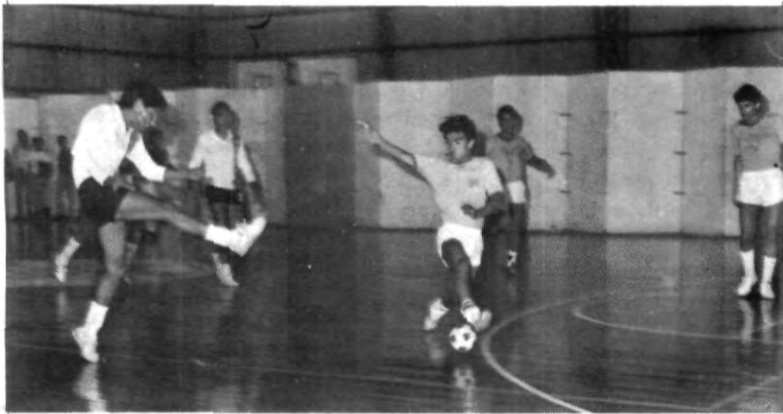
Los excelentes resultados que ha obtenido el equipo de futbol rápido de la UPAEP, ha dado gran prestigio a la Universidad lo que se refleja en la invitación a torneos internacionales

Cabe señalar que los méritos que ha hecho la UPAEP para ser invitado especial a este torneo son diversos, ya que ha sido campeón estatal en varias categorías, subcampeón Regional del Consejo Nacional Del Deporte Estudiantil (CONDDE), y tercer lugar Nacional de dicho organismo; por lo que ahora buscará cerrar con broche de oro el año teniendo una buena actuación en este Internacional.