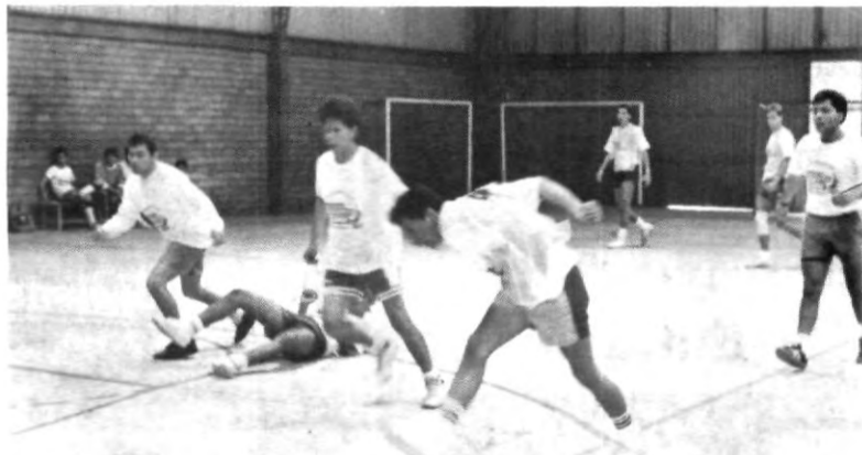
El Torneo Interior de Futbol de Salón se acerca a su recta final y los partidos suben de nivel y competitividad, por lo que hay que estar pendientes de los encuentros programados