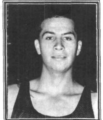
Importante oportunidad tendrán los jóvenes integrantes de las Águilas en México