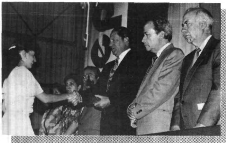
En solemne ceremonia realizada el 15 de octubre, fueron entregados los premios Cruz Forjada, Mérito al Estudio y Mención Honorífica. Felicidades a todos los galardonados.