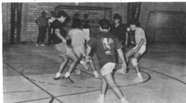
Este lunes inician los partidos eliminatorios en ambas ramas dentro del torneo interior de futbol de salón

El horario de los partidos es el siguiente: Martes, 14:00 hrs. Danger vs. Roma; 16:00, Compusystem vs. Conta 9o.; 17:00, Ex-Prepas vs. Trocadores. Miércoles: 11:00 Ing. Química vs. R..Madrid; 14:00 Catedráticos vs. Psicosis. Jueves: 12:00, Unificado vs. Internacionale; 13:00 Toledo vs. DECOS.