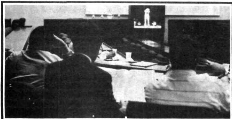
En conjunción de esfuerzos y adelantos tecnológicos en materia de comunicaciones, el ITESM; BANCOMEXT y UPAEP, transmiten de una manera ágil el programa de Formación Técnica en Comercio Exterior.

EL EVENTO SE APROXIMA CONFIRMA TU ASISTENCIA 9 Y 10 DE NOVIEMBRE