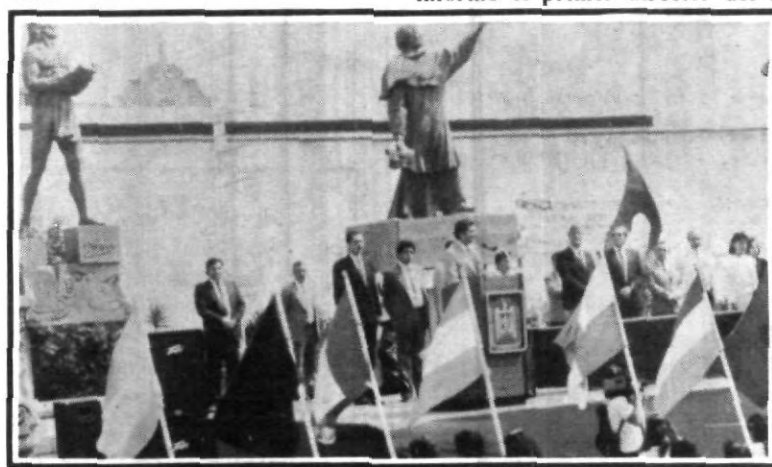
A quinientos años del inicio de nuestra cultura e identidad nacional.