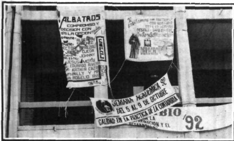
¿Dónde está el orden universitario, jóvenes estudiantes?