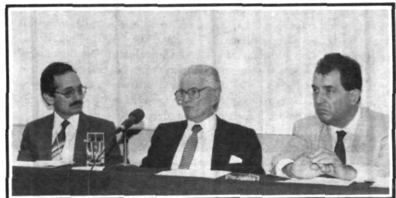
El tren ligero problemático para que circule por las calles de Puebla informó el primer director del metro de la ciudad de México.