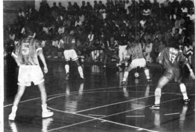
Las Águilas tendrán un difícil partido de semifinal frente a los Gallos del Centro de Estudios Universitarios de Monterrey (CEU)