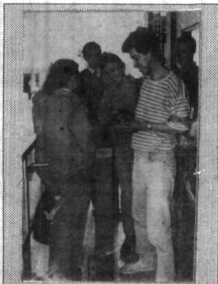
Como medida de seguridad, la semana anterior se solicitó la credencial en la entrada.