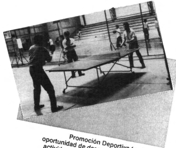
Promoción Deportiva te ofrece la oportunidad de desarrollarte en diferentes actividades, como lo es el tenis de mesa.