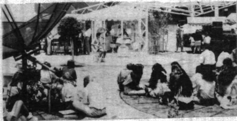
Los Miércoles Culturales continúan con paso firme llevando un rato ameno y entretenido para todos.