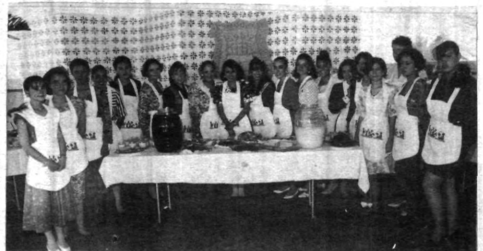
Las alumnas del 4º semestre de Administración de Instituciones, presentaron su primera gran muestra gastronómica.

Negar en el hombre la necesidad de una religiosidad, conduce al mismo tiempo, negar al hombre mismo.