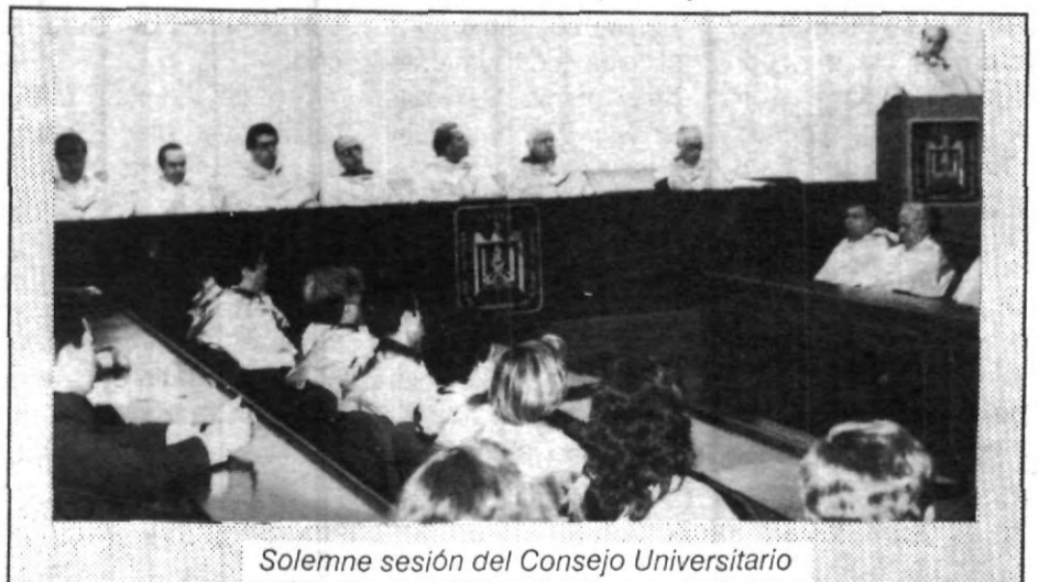
Solemne sesión del Consejo Universitario