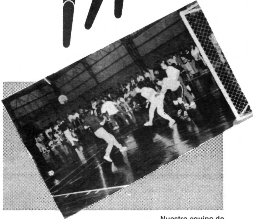
Nuestro equipo de Escala en Roca

Por último sólo nos queda desearles suerte a nuestros equipos de fútbol rápido y de basquetbol que nos representarán en esta fiesta deportiva organizada por el CONDDE .