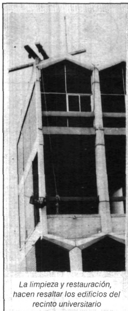
La limpieza y restauración, hacen resaltar los edificios del recinto universitario