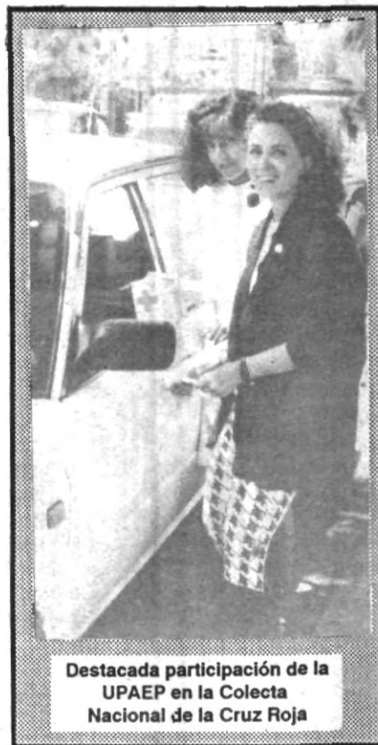
Destacada participación de la UPAEP en la Colecta Nacional de la Cruz Roja

Para concluir, el funcionario universitario aseveró que en el Primer Simposium Internacional de Arte Sacro celebrado en la ciudad de México y cuya sede fue el Edificio de la Confederación Episcopal Mexicana del 24 al 28 de febrero, se estableció, entre otras cosas, la importancia de la relación entre las instituciones de carácter público y eclesiásticas para que los bienes e inmuebles que se consideran arte sagrado perduren en el tiempo y se vuelvan trascendentes.