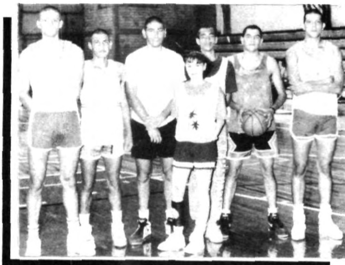
Estos son los nuevos integrantes del equipo de basquetbol Aguilas UPAEP

Pero al fin y al cabo, cada quien echa el agua a su molino y pocos son los que asumen su verdadero papel, el de informar objetivamente. Parece ser que nadie ha comprendido que el fútbol mexicano sólo progresará cuando jugadores, directivos y medios de comunicación luchen por el mismo objetivo.