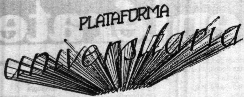
Por: Bernardo Granados

Como cada semana estamos con ustedes y les saludamos desde la redacción del Universitario. En esta ocasión les preguntamos a los compañeros sobre si sabían que era el Consejo Universitario y cuáles eran sus funciones. Esto fue lo que nos respondieron: