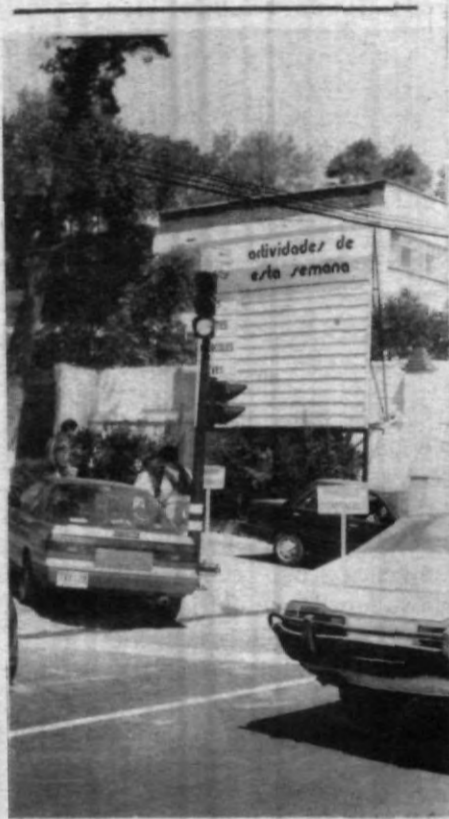
En las afueras de la Universidad, se cuenta con un sofisticado sistema de semáforos.

Expuso que en ningún momento se prometieron puntos extras a quienes asistieron a la asamblea debido a que, mencionó, eso va en contra de los principios académicos de la Universidad. A la vez indicó que quienes asistieron, lo hicieron libre y voluntariamente y sin ninguna coacción.