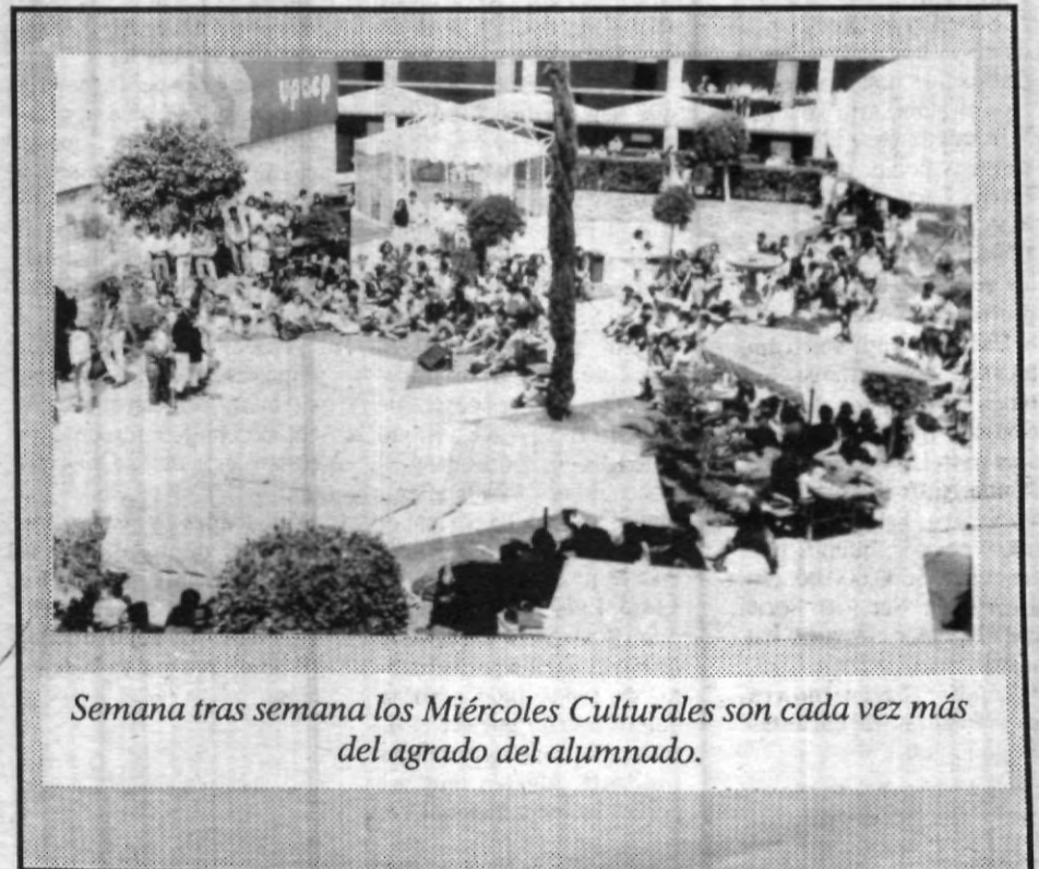
Semana tras semana los Miércoles Culturales son cada vez más del agrado del alumnado.

Finalmente reiteró la gran ayuda que resulta un semáforo versátil en cuanto a su programación, ya que es muy útil y evita pérdida de tiempo en los transeúntes.