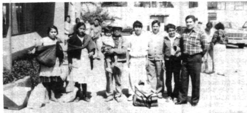
El Servicio Social durante 1991, benefició a un total de 70 mil habitantes de 14 comunidades rurales y a 110 mil personas de 12 comunidades sub-urbanas.

En cuanto a los programas asistenciales, fueron 210, en el que participaron 880 alumnos en 63 instituciones públicas y privadas, así como de beneficencia, e instituciones de comunicación como prensa, radio y televisión, y 104 programas con 480 alumnos fueron para investigación, docencia-servicio, que se brindó para la realización de proyectos de investigación, tesis, docencia, tanto en bachilleratos de la UPAEP, como incorporados y en el Instituto de Capacitación de la misma universidad. También, tuvieron nuevas áreas de oportunidad con programas como el de CANACOPE, BANPECO y NAFINSA, consistentes principalmente en asesorías a la pequeña y mediana industria y comercio, así como en los programas de vinculación Universidad-Empresa.