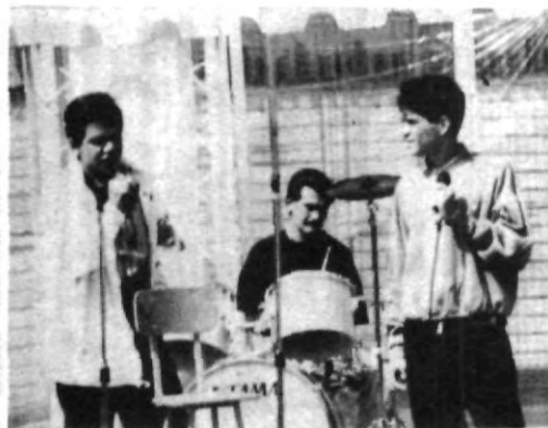
Ultima intervención de los Miércoles Culturales, por este semestre