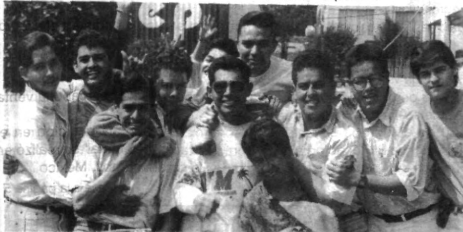
Entusiastas compañeros de Agronomía, nos muestran la integración de su carrera.