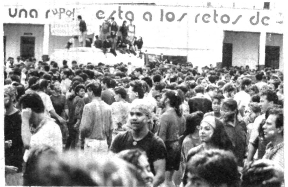
Una gráfica del gran ambiente que se vivió en la UPAEP con motivo de la bienvenida a los "pelones", y la integración a su Alma Mater.

La novatada significó un primer paso a la integración que se busca en los jóvenes que ingresaron a la UPAEP; el ser "águilas" con plena libertad pero también con responsabilidad para volar alto en cumplimiento de lo que el creador quiere de cada uno de nosotros.