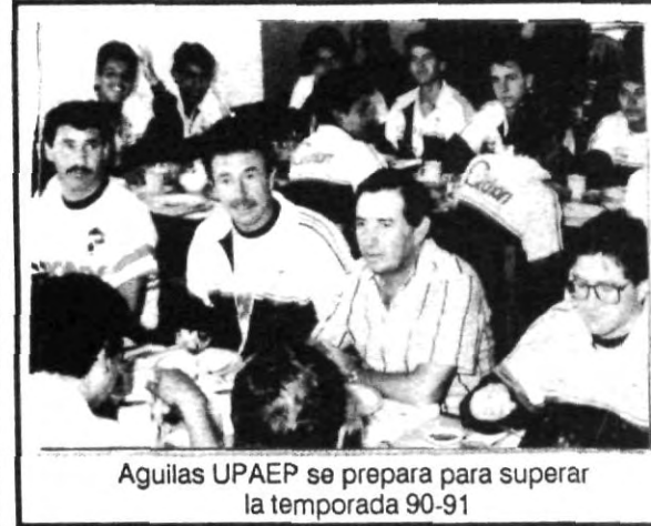
Aguilas UPAEP se prepara para superar la temporada 90-91

En la mira de todos los integrantes de las "Aguilas" está el campeonato de Tercera División y con ello superar lo realizado en la temporada 90-91, cuando fueron campeones de su zona y llegaron a semifinales.