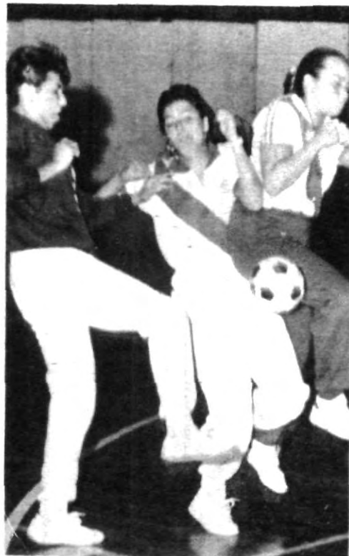
¿Quién dijo que las mujeres no le entran duro?