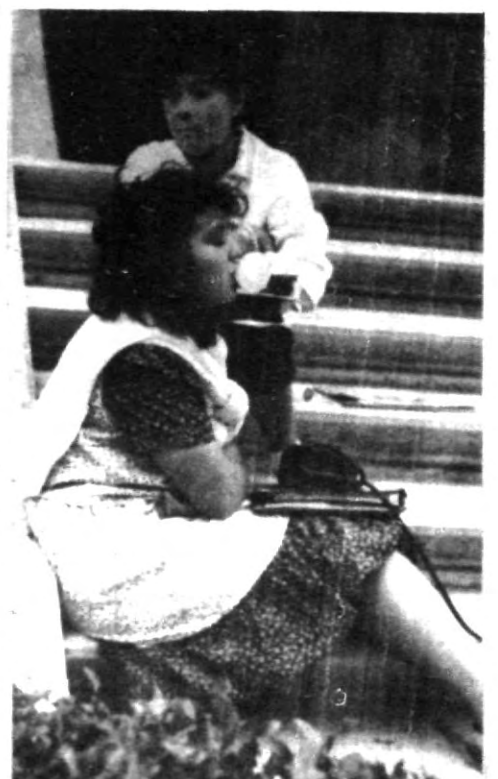
¿Concentración?, sí, eso es todo lo que necesitas para hacer una super bomba

Participa en EL UNIVERSITARIO y forma parte de la juventud dinámica de la Universidad.