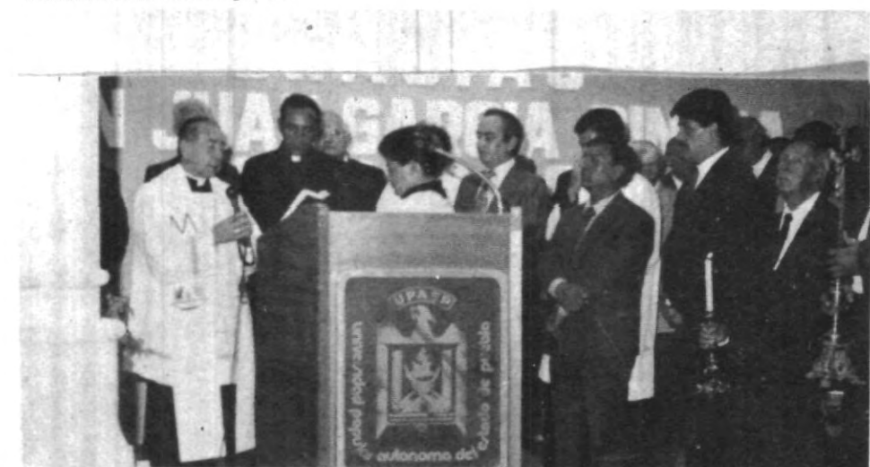
Su Eminencia Ernesto Corripio durante la bendición de las nuevas y funcionales instalaciones del Hospital UPAEP.