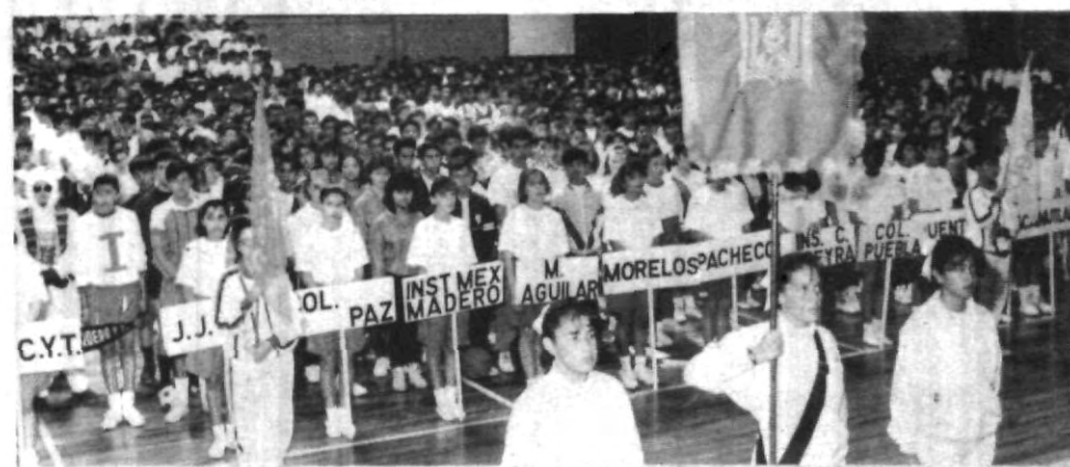
Solemne y llena de entusiasmo deportivo resultó la ceremonia inaugural del torneo deportivo y Cultural de las Interprepas.

Luego de tres días de fragorosa batalla concluyeron con gran éxito los encuentros de futbolito, basquetbol y volibol pertenecientes al VIII Torneo Cultural y Deportivo que organizó la Dirección de Preparatorias, en el cual tomaron parte más de 380 alumnos de preparatorias particulares y del sistema oficial.