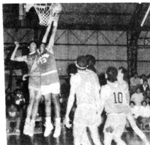
El equipo de basquetbol Águilas UPAEP siempre se ha mantenido en los mejores lugares de los diversos torneos.