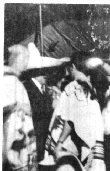
¿saben quién es? si es así, corre y ve a la oficina de Prensa, donde habrá una agradable sorpresa.