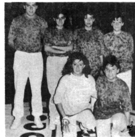
Los torneos de futbolito femenino cada vez toma más auge.