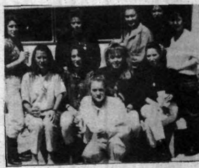
Bellas chicas del Americano.