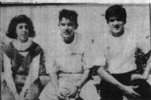
Tomando un rico sol de marzo.