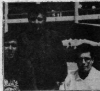
En un rato de descanso.