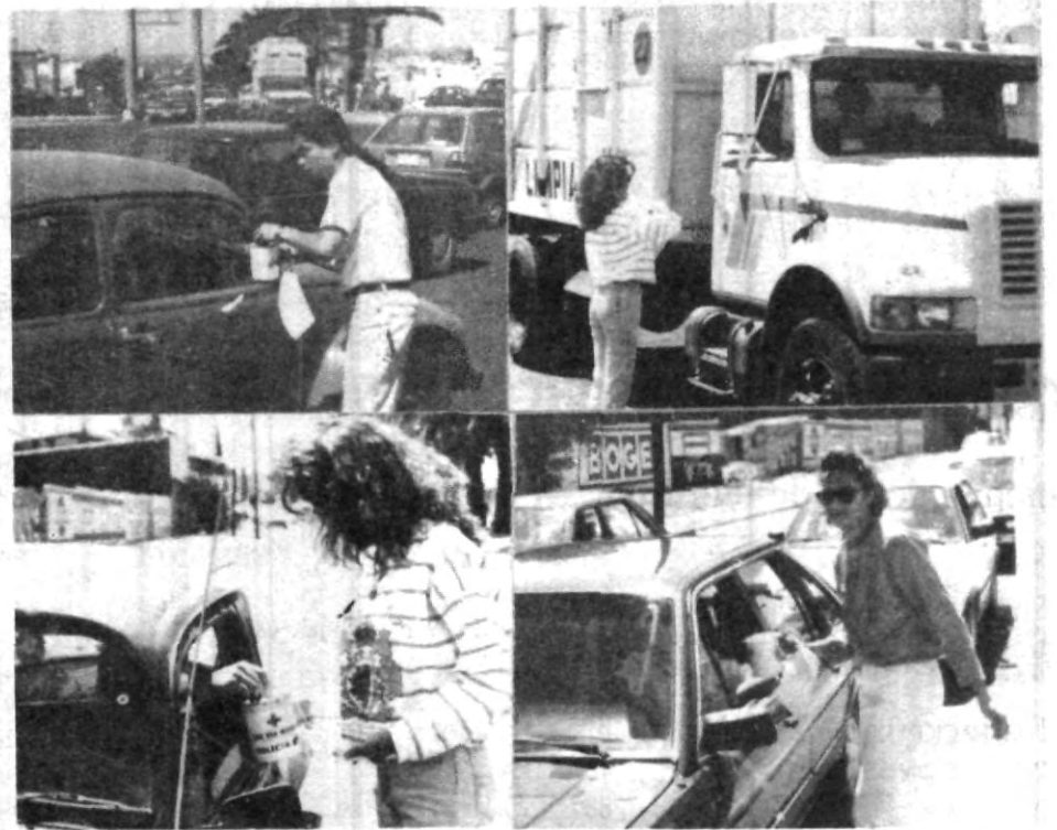
Gráficas que muestran la participación de los jóvenes que con gran entusiasmo realizan año con año sin importarles el sol y a veces el peligro que implica la colecta en las principales avenidas.

En este día de la Colecta los estudiantes universitarios han tenido la oportunidad y el privilegio de servir a los demás, 7 horas de servicio les han permitido manifestar que sí se puede vivir en un mundo de cooperación y solidaridad.