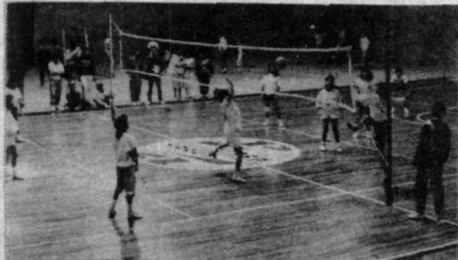
Las chicas del equipo de volibol en plena acción.