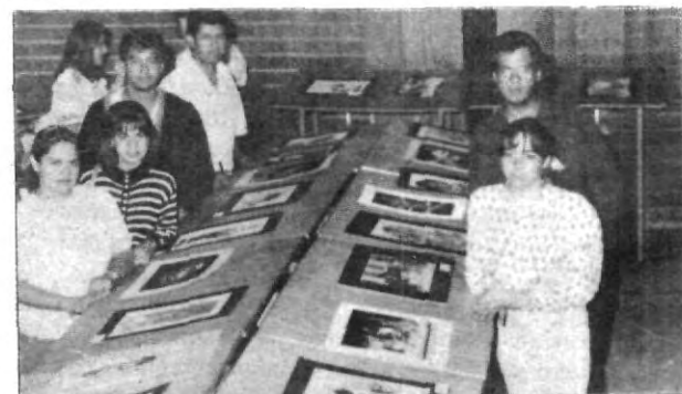
Los jóvenes estudiantes de Diseño, mostrando sus trabajos a la cámara de el Universitario.

Felicidades a todos los alumnos del segundo semestre de Diseño Gráfico que participaron en la exposición.