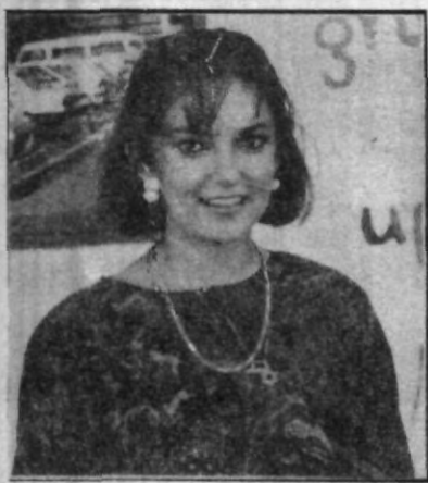
Susana piensa que la mujer debe prepararse y superar la mediocridad.

"La mujer no debe caer en la mediocridad, debe preocuparse por su autodesarrollo" subrayó Susana; además que existe un mismo nivel intelectual entre mujer y hombre para prepararse.