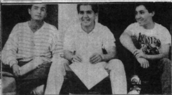
Cualquier lugar es bueno para convivir con los amigos.