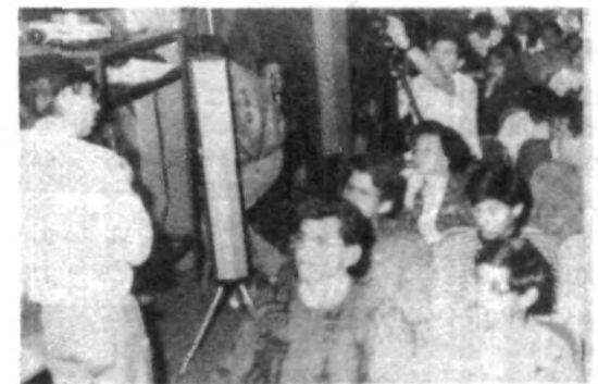
Bastante interesante y concurrida resultó la conferencia del doctor Apolonio Juárez sobre el eclipse del próximo 11 de julio.

Finalmente, el ponente remarcó algunas recomendaciones para la observación del eclipse y son las siguientes: no