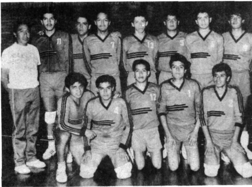
Nuestro excelente equipo de volibol varonil se hace presente en el Universitario

COLABORA CON EL UNIVERSITARIO, MANDA TUS ARTICULOS, POESIAS, NOTAS, FOTOS, MENSAJES EN ENSALADA UNIVERSITARIA O ALGUNA OTRA COSA. DIRIGETE A LA OFICINA DE PRENSA LOS LUNES DE 10:00 A 13:00 HORAS. PARTICIPA CON NOSOTROS.