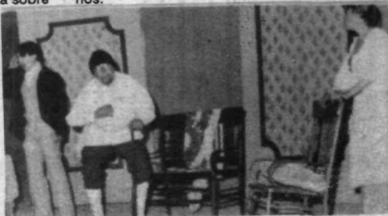
Escena de la obra "Petición de Mano".

tentes a este evento cultural organizado por las autoridades correspondientes y con el fin de complementar la formación integral de los alumnos.