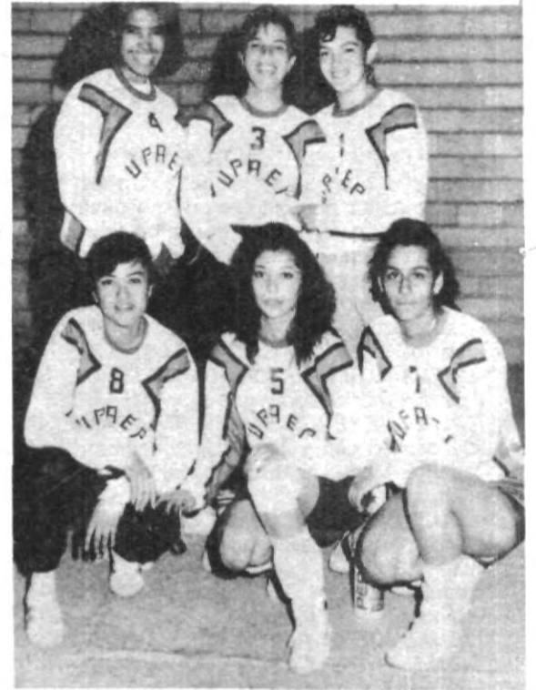
Las chicas del equipo de volibol femenino.

Este encuentro, resultó más parejo, pues aunque se definió en sólo dos sets, las volteretas en el marcador estuvieron a la orden del día. Durante el primer cotejo tanto la UAP como la UPAEP mantuvieron latente la expectativa de los aficionados, con jugadores excelentes tanto a la defensa como en los remates y "picadas" ofensivas, prin-