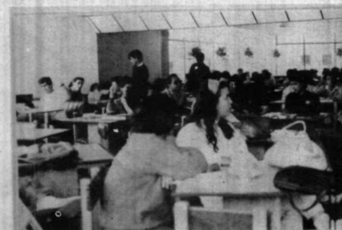
Los programas por tele en la cafetería han resultado todo un éxito.