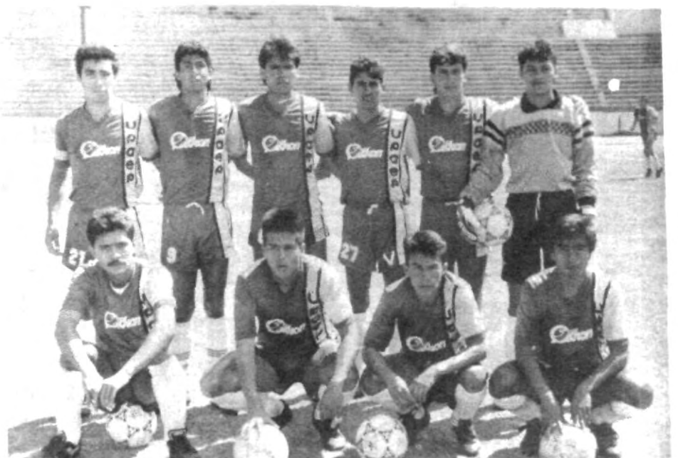
Las Aguilas van en pleno vuelo hacia los primeros lugares de clasificación.

ESCRIBE PARA TU PERIODICO. RECUERDA QUE TODOS FORMAMOS PARTE DE EL.