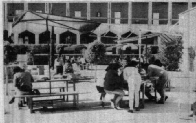
De mucho han servido las nuevas secciones de esparcimiento.