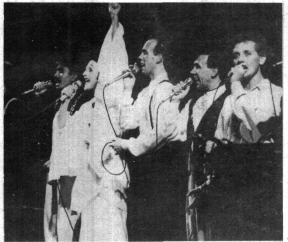
Exitosa fue la presentación de GENROSSO en la UPAEP

"Aunque nos hemos presentado en espectáculos masivos, nosotros le cantamos a cada persona, no a un público", dijo el italiano.