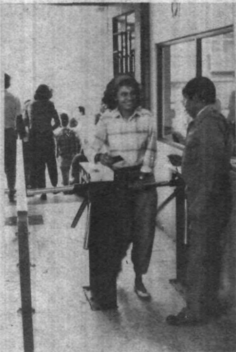
Desde la puerta principal, la Universidad te sonríe. ¡Bienvenidos!