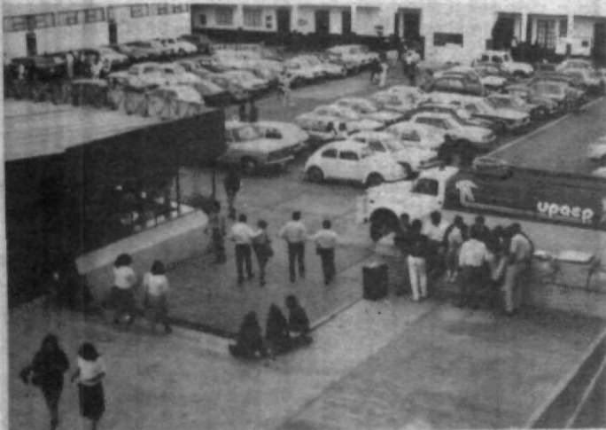
Muchas son las formas en que la Universidad colabora en tu desarrollo.