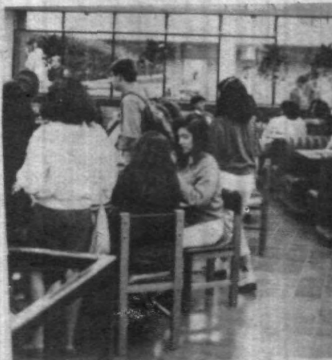
Nuestra cafetería cada día brinda un mejor servicio y atención. ¡Felicidades a todo el equipo!