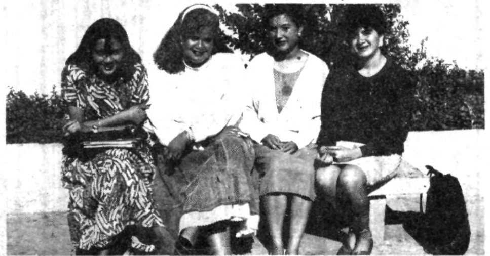
Todavía hay alegría a unos días de los exámenes