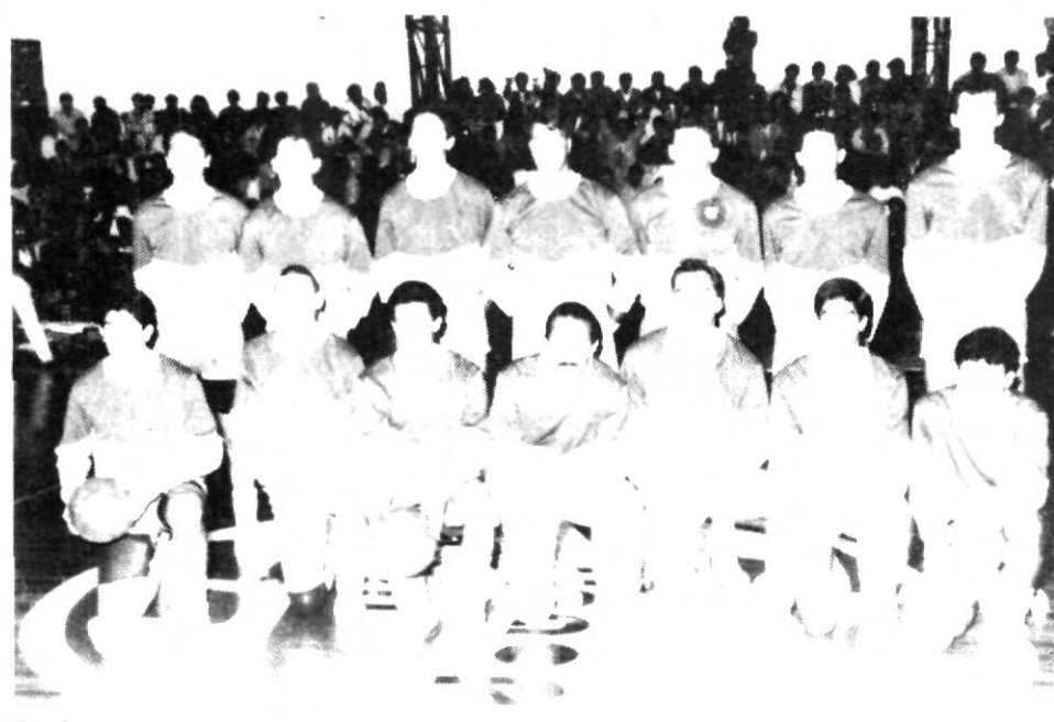
El cuarto lugar del cuadrangular la UDLA