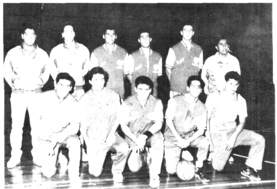
El equipo de basquetbol del ITESM, campus Monterrey