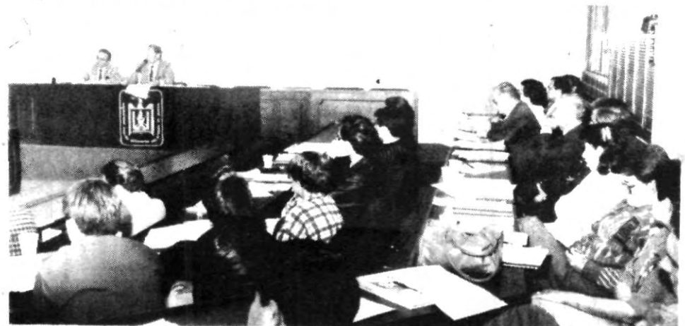
En plena sesión el Consejo Universitario

Gracias a esto, se le ha podido dar respuesta a muchos de los problemas que vive la universidad, además de buscar la excelencia académica en cada uno de los alumnos de la Upaep.