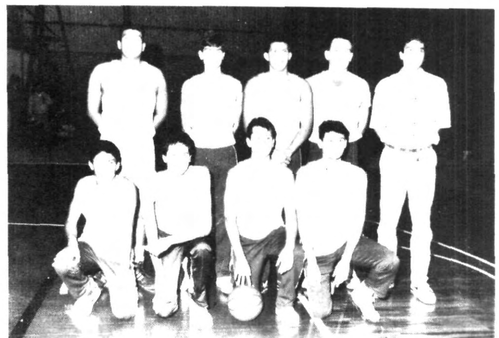
El equipo segundo lugar CEU de Monterrey