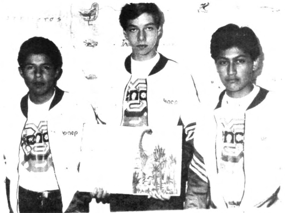
Autores del proyecto ¿quién recuerda a los dinosaurios?

Se felicita cordialmente a éstos jóvenes, y se les desea el mayor de los éxitos en Praga.