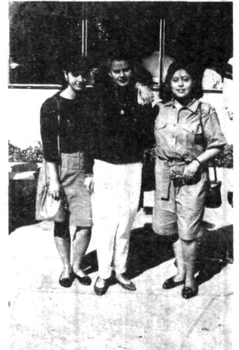
Hasta el próximo semestre