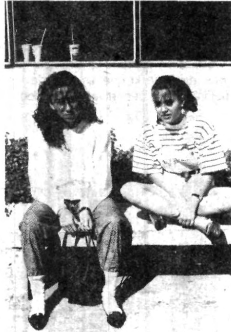
Disfrutando los últimos días del curso

Estos ingredientes tienen efectos especiales que calman, o estimulan el cuerpo y la piel, según sea el caso.