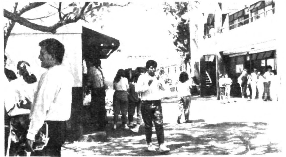
Agradable ambiente en la Prepa número Uno