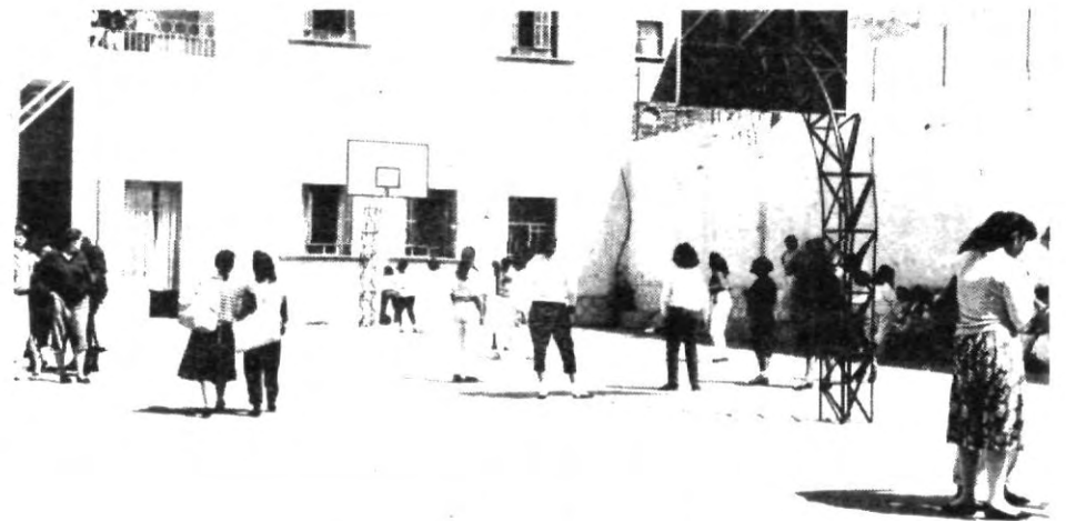
Un poco de esparcimiento para las chicas de la Prepa Tres