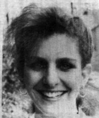
El Club de Toby pag 3

Se les invita a todas las chicas de la prepa 3, seguir con ese entusiasmo en la campaña, pues contribuirán al mejoramiento de nuestra escuela y en beneficio de todas.