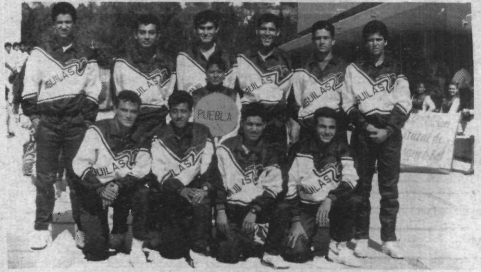
El equipo campeón de la UPAEP

El partido de la final se tornó para un solo lado, en donde el equipo contrario (Morelos), no mostró nada a la ofensiva, quedando clara su incapacidad e ineficiencia para el basquetbol, en cambio la UPAEP demostró su gran juego de conjunto e individual, por ende se consolida como un amplio favorito para ganar el Nacional.