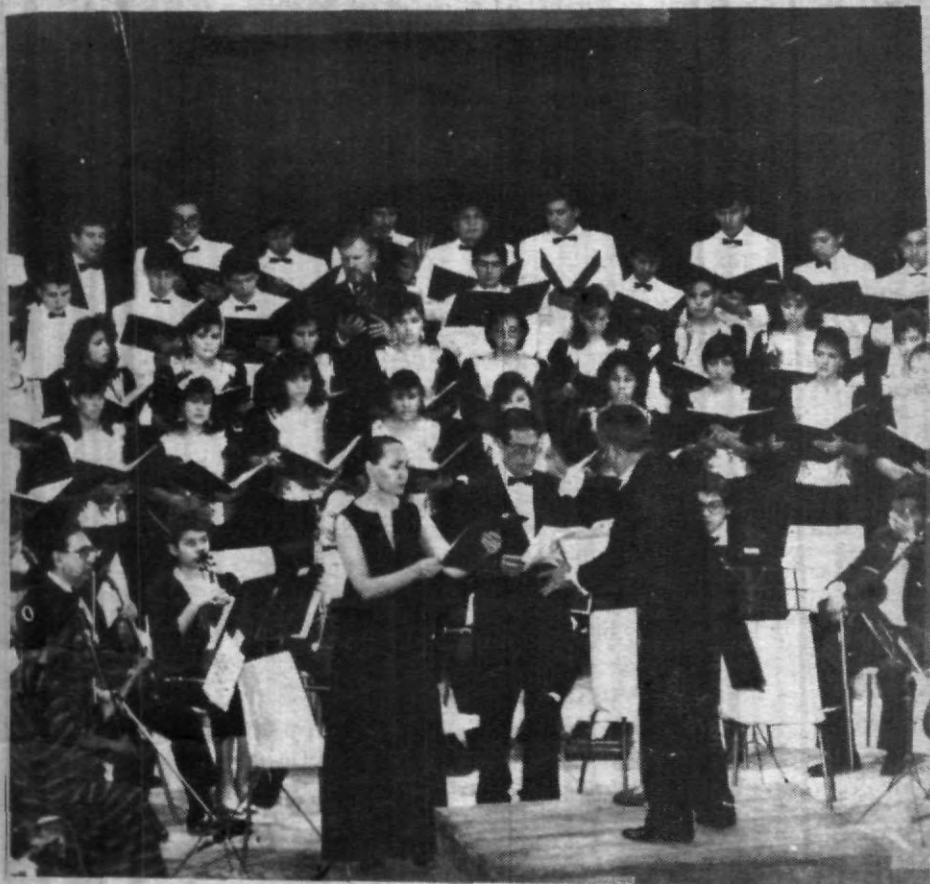
El Orfeón Interuniversitario durante una presentación