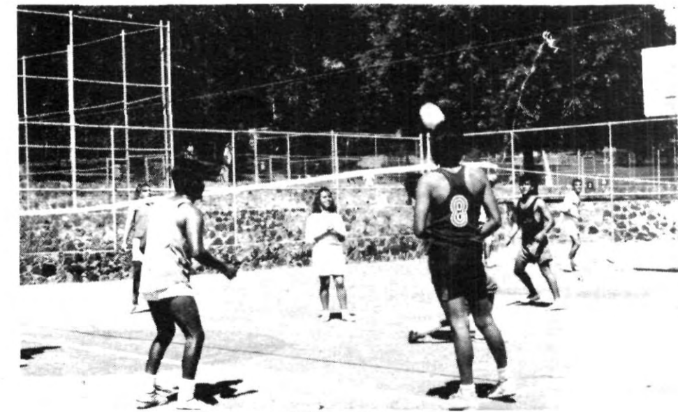
Grata resultó la convivencia Cicom