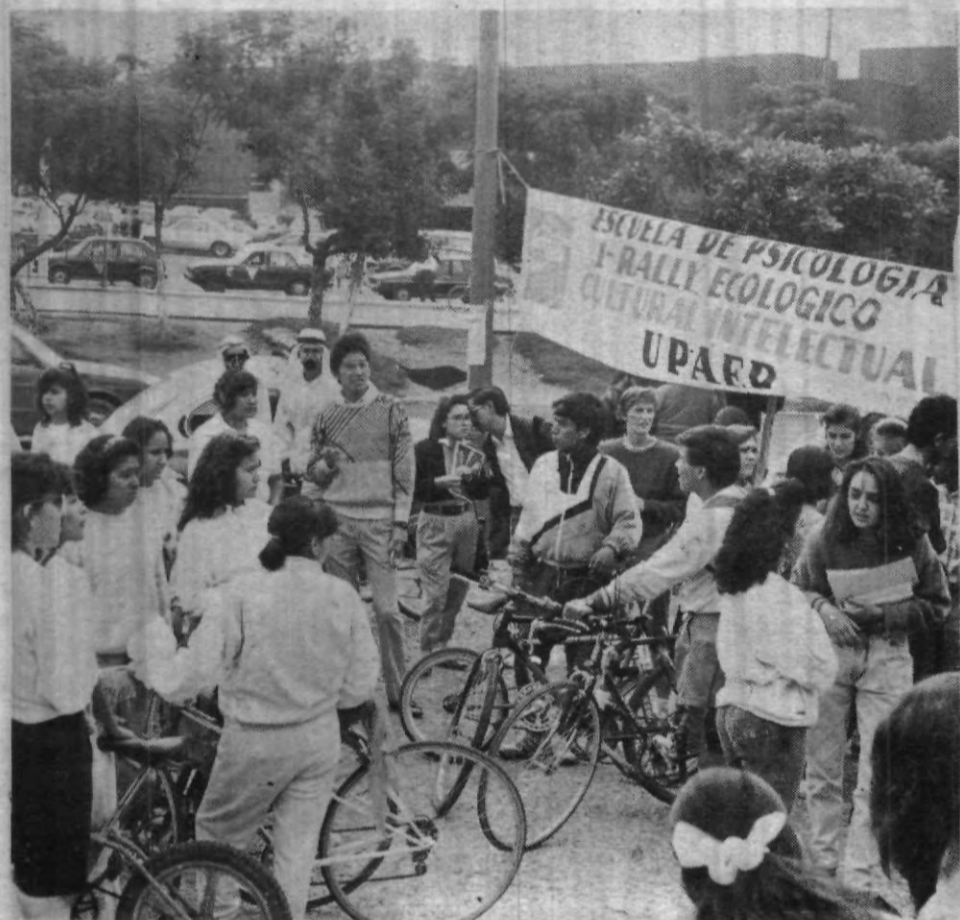
Agradable convivencia fue la del Rally Ecológico