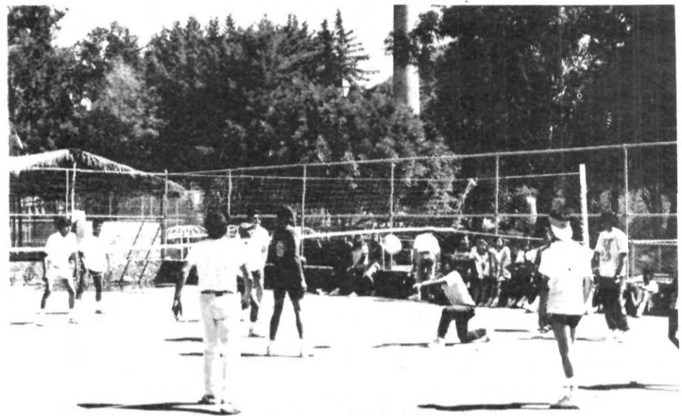
Emocionantes jugadas durante el paseo