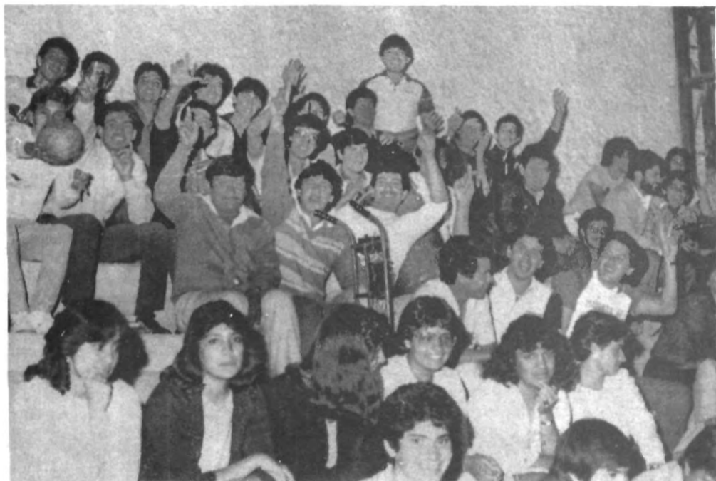
TODA UNA muestra de pundonor dio la quinteta de la UPAEP, durante el último encuentro celebrado contra la UDLA. Tanto el equipo como la comunidad merecen una felicitación por su comportamiento y apoyo decidido.