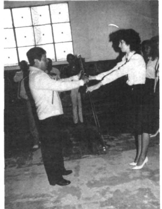
EL PRESIDENTE municipal de Cuetzalan abanderó a la escolta de la Preparatoria de la Universidad Popular Autónoma del Estado de Puebla; el reconocimiento al trabajo de la institución se hace patente en dondequiera que deja ver su trabajo.