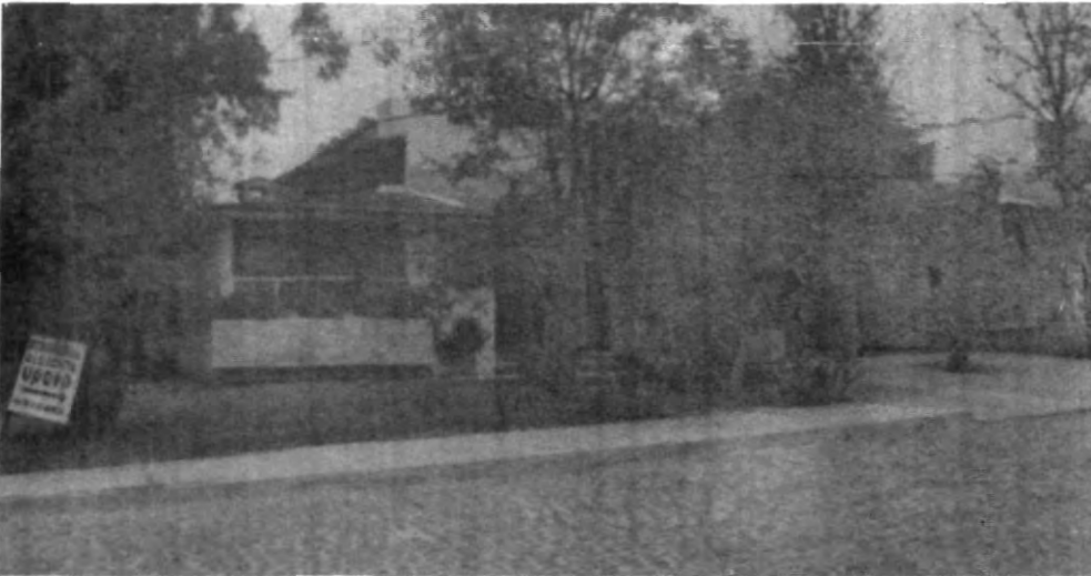
ESTA ES LA residencia completamente amueblada que constituye el primer premio del "13o. Sorteo UPAEP" que se llevará a cabo el próximo 7 de mayo. En este evento se cumple de una manera fehaciente el principio de solidaridad social en que se fundamenta el modelo de la UPAEP.