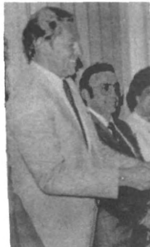
LAE. MARIO Iglesias García Teruel, rector de la UPAEP, anunció que durante el presente año la institución implementará todo un programa para promover el deporte.