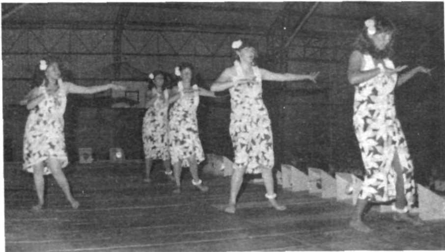
Dentro de las muchas oportunidades que los estudiantes tienen para desarrollar sus habilidades artísticas se encuentra, el grupo de ballet Taitiano. Aquí durante su presentación ante la comunidad universitaria.