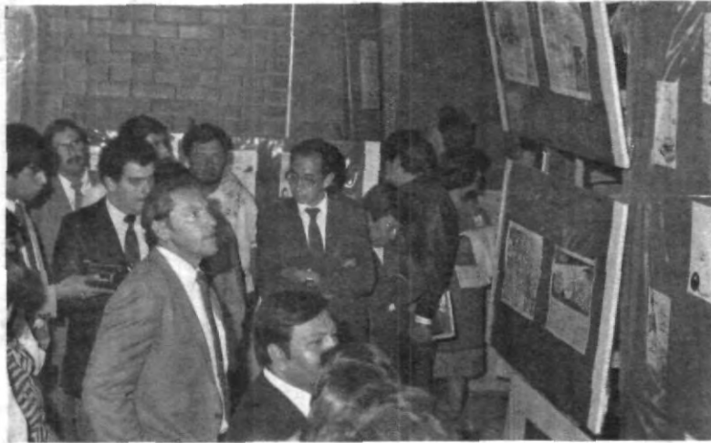
ESTUDIANTES DE LA Escuela de Comunicación, montaron una exposición con las caricaturas del famoso periodista Francisco Calderón.