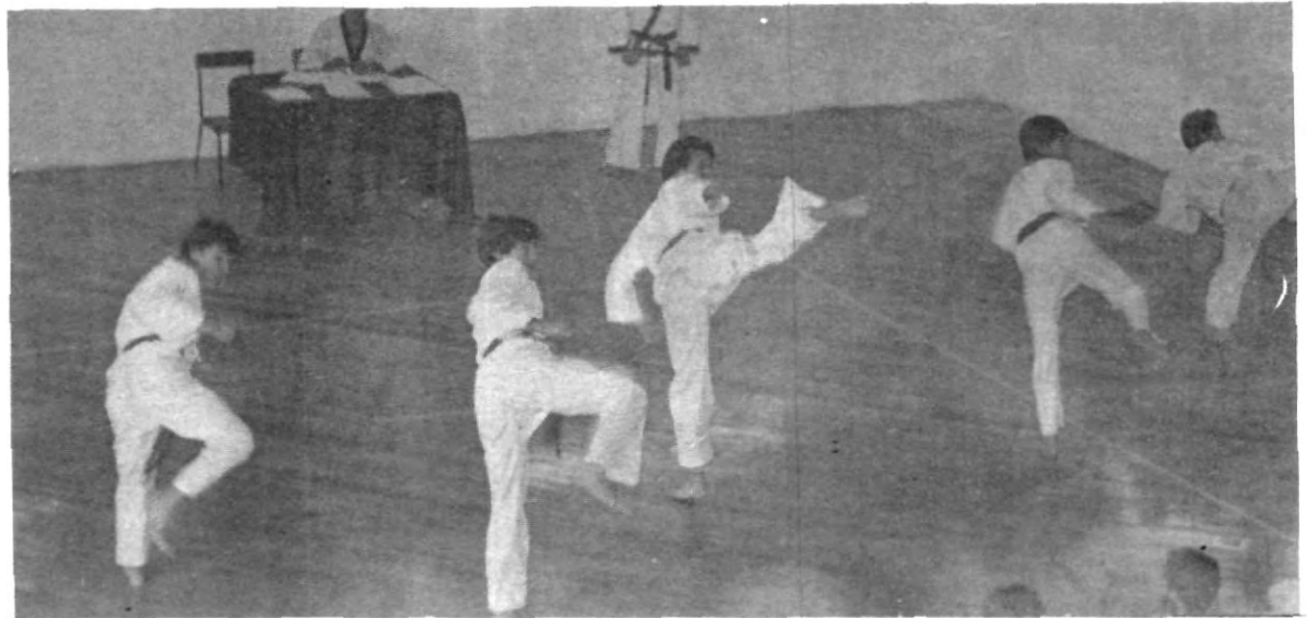
Las artes marciales son entre otras, una de las actividades deportivas que los estudiantes de las diferentes escuelas profesionales de la Universidad Popular Autónoma del Estado de Puebla, tienen la oportunidad de practicar para el mejor desarrollo de sus facultades.

Hablar de deporte y del deportista en nuestros días, es hablar de una combinación de responsabilidad y salud, es la fusión entre los ejercicios y el sentimiento de superación que poseen entre los ejercicios y el sentimiento de superación que poseen los hombres; es el coraje de los seres humanos para romper todas las barreras u obstáculos que se les presenten en la vida. En la Universidad Popular Autónoma del Estado de Puebla, aparte de acrecentar el desarrollo intelectual y académico de los alumnos, se promueve también el enriquecimiento de los valores físicos que poseemos, para poder así formar profesionistas con carácter, el cual pueda vencer todos los obstáculos que encuentre en su vida. LA UPAEP PROMUEVE EL DEPORTE PARA PUEBLA.