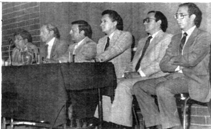
DURANTE LA ULTIMA semana de junio se llevó a cabo en la UPAEP, el "Primer Diálogo Ciencia y Fe", en el cual se disertó sobre las íntimas relaciones que hay entre las cuestiones temporales y las eternas.