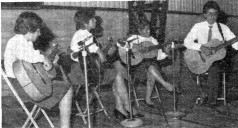
EL GRUPO DE GUITARRA CLASICA de la UPAEP también hizo su presentación junto con todos los grupos artísticos de la Institución.

Después de lo anterior, se proporcionó una serie de recomendaciones a los propios estudiantes y a sus padres para que mediante la perseverancia se logrará modificar los hábitos negativos que estaban obstruyendo en alguna forma su aprovechamiento, y por el contrario, a base de esa misma perseverancia, lograrán integrar a su personalidad los hábitos positivos necesarios para un desarrollo escolar feliz, finalizó la funcionaria.