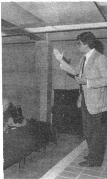
UN ESTUDIANTE DE La Escuela de Filosofía durante su participación en la final del concurso de Oratoria 84 universitarios se inscribieron para este evento.