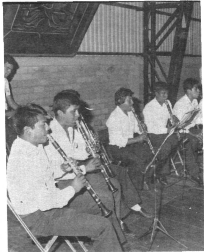
LA BANDA DE MUSICA, grupo artístico de la UPAEP, que de una manera especial sirve de canal para que los estudiantes desarrollen habilidades diversas.