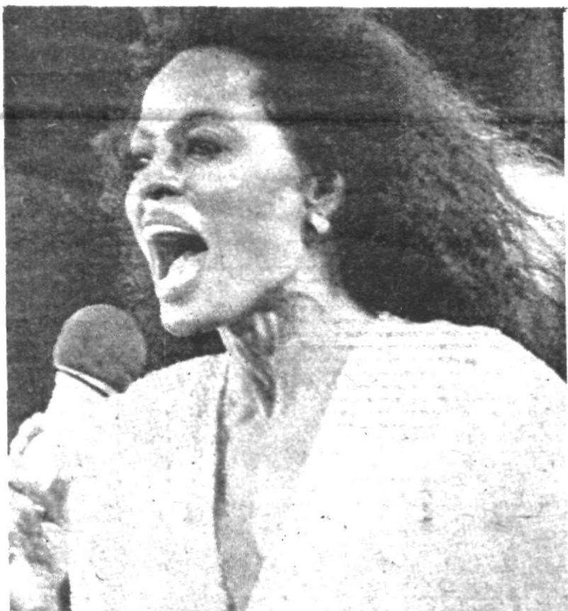
Aquellos temas que exaltan las pasiones y que suelen tener un "mayor éxito comercial" tiene prioridad aunque hagan más daño. Sin embargo el jurado ahora le fallaron los cálculos.

Finalmente explicó, que en este trabajo cabe destacar lo útil que ha resultado elaborar una tecnología que toma en cuenta por una parte la problemática del adolescente, y por otra, la trayectoria de hechos que han generado las deficiencias educativas actuales, así como el medio ambiente propiciado. Conociendo las raíces del daño, es posible implementar sus antídotos, dijo.