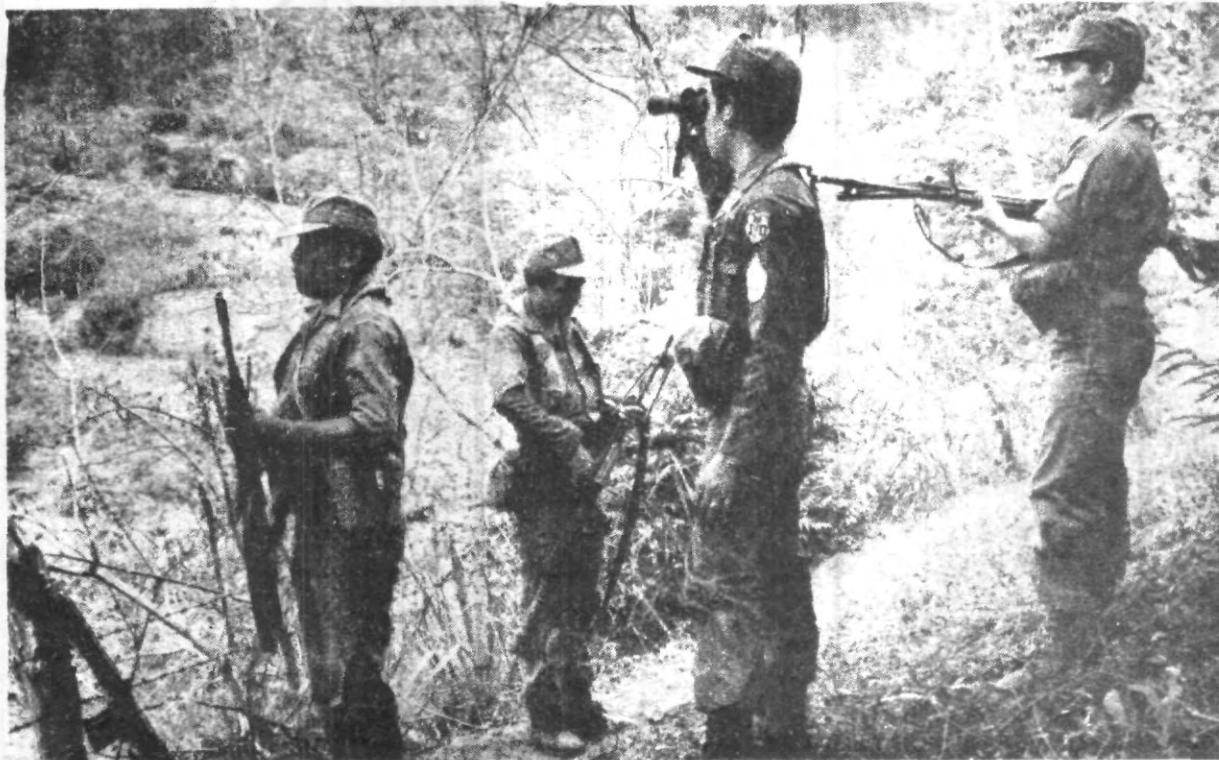
Actualmente en Centroamérica se libra una lucha política en la que mucho tienen que ver los llamados grupos de “izquierda”. Guerrilleros y terroristas son buscados a campo traviesa.