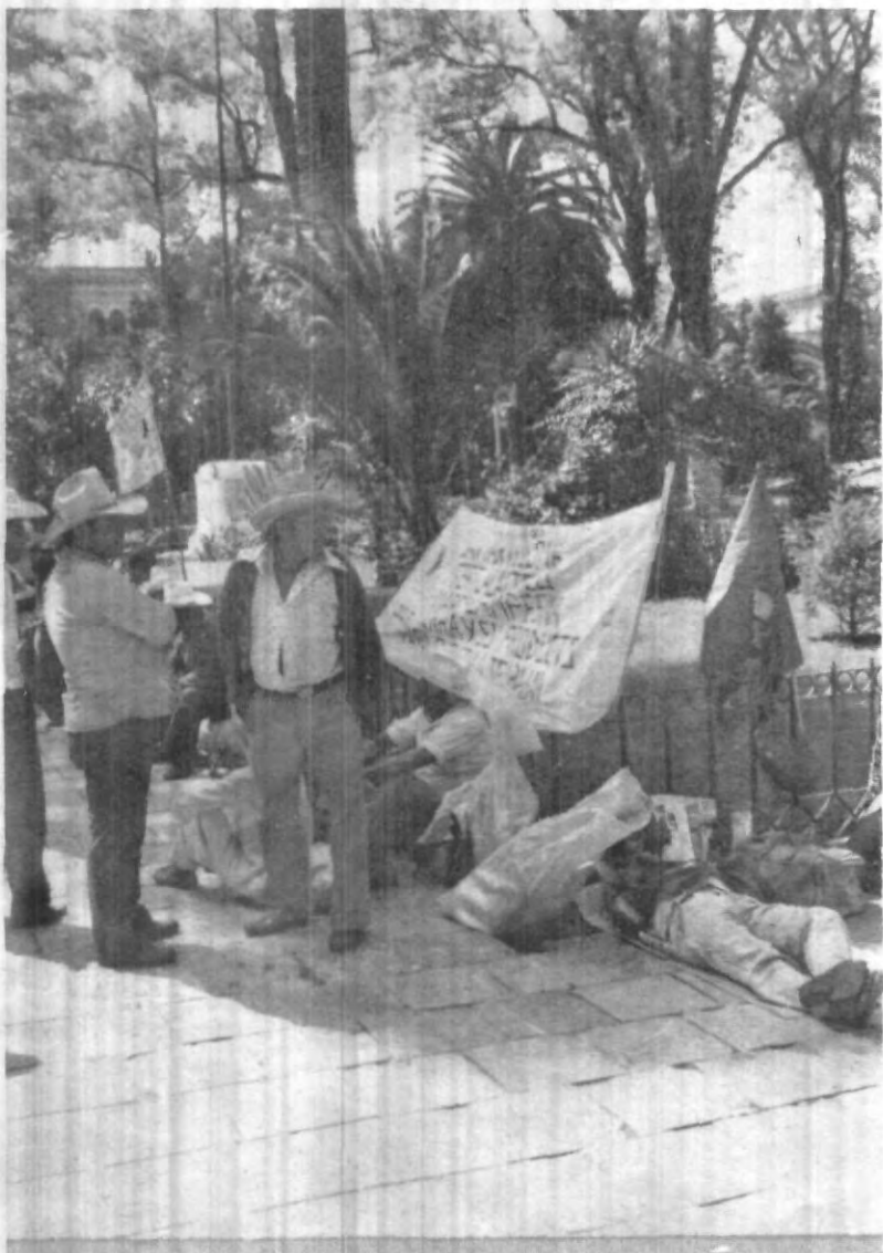
Los campesinos son frecuentemente manipulados por grupúsculos. Ellos nada saben de “izquierdas, derechas” ni nada que se les parezca. Lo único que buscan es justicia. Lamentablemente ellos y gran parte de la población se pierden en la llamada “geometría política”.

Finalmente destacó el Lic. Castellanos, que en esta actividad investigada se ha tomado en cuenta a los alumnos más destacados, aunque de hecho en general a todos y cada uno de ellos se les infunde la idea de la gran necesidad que se tiene de alcarar y reorientar ideas en el campo de la filosofía de donde emergen todos aquellos que influyen positiva o negativamente en la humanidad.