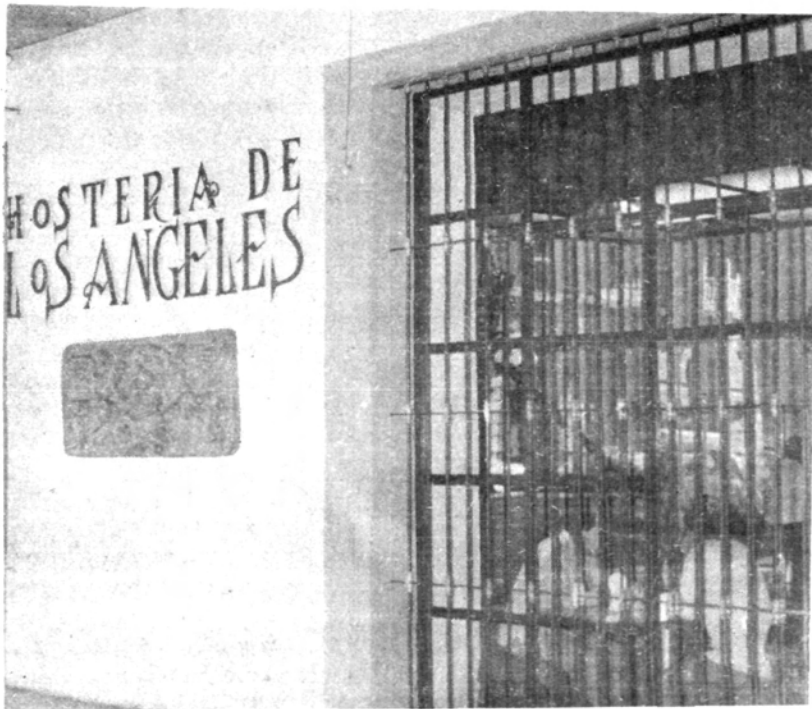
Planta Baja del Hotel del Portal