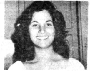
Alumna del Instituto Social Femenino Pue.