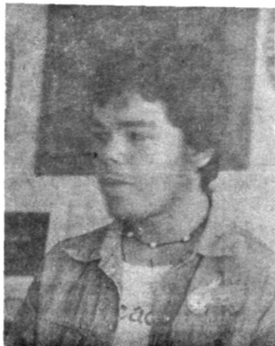
Por Mario Chapital.