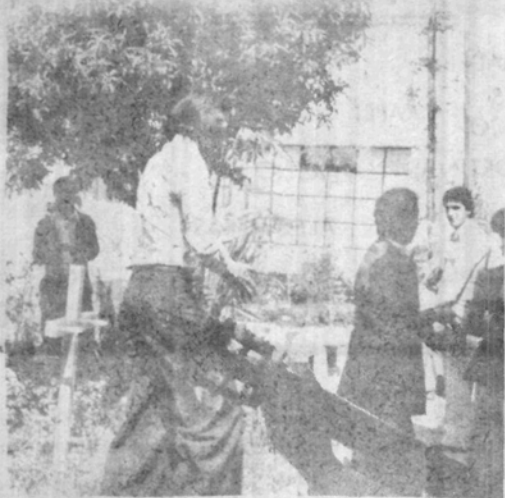
Arquitectura e Ingeniería celebraron el día de la Santa Cruz.

HACE 4 AÑOS UN PUÑADO DE HOMBRES VALIENTES Y DECIDIDOS, FUNDARON ESTA UNIVERSIDAD, AHORA NOSOTROS DISFRUTAMOS DE LA SEMILLA QUE SEMBRARON CON DOLOR Y REGARON CON SANGRE. GOCEMOS ESTE 7 DE MAYO NUESTRO ANIVERSARIO, SIN OLVIDARNOS DE LOS CIMENTOS EN LOS QUE ESTAMOS APOYADOS.