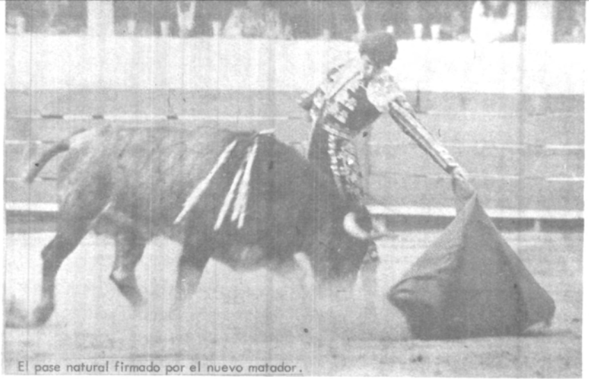
El pase natural firmado por el nuevo matador.