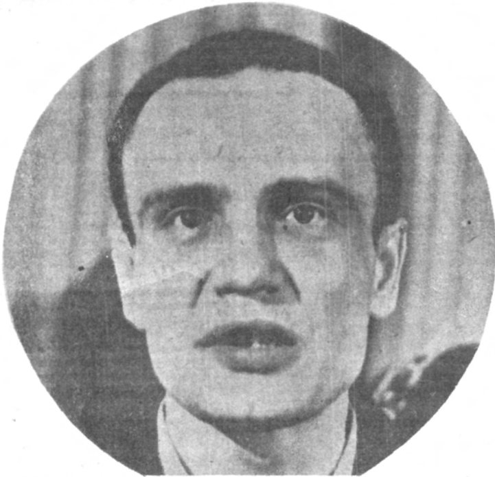
VLADIMIR BUKOVSKI, el último disidente ruso liberado en un canje por el líder comunista chileno, Luis Corvalán fue captado en Suiza mientras explicaba a los periodistas las condiciones en que viven los disidentes que se encuentran en asilos psiquiátricos.