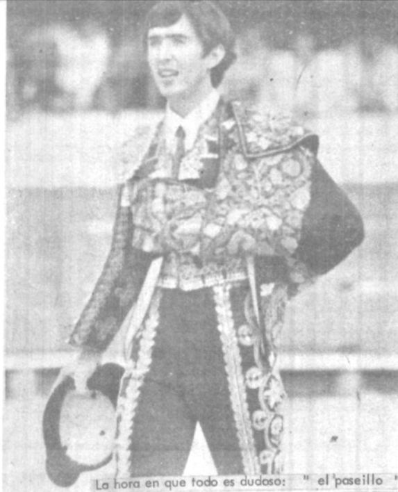
La hora en que todo es dudoso: " el paseillo "