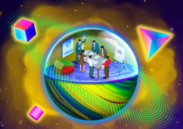
Administración de Empresas