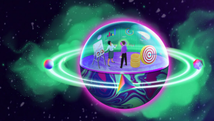
Administración Financiera y Bursátil