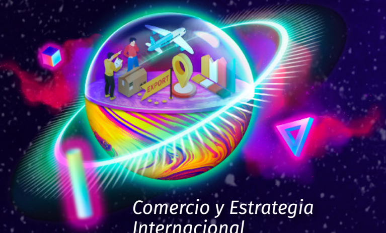
Comercio y Estrategia Internacional