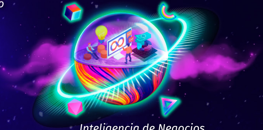
Inteligencia de Negocios