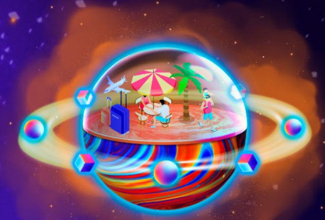
Dirección de Hospitalidad y Turismo