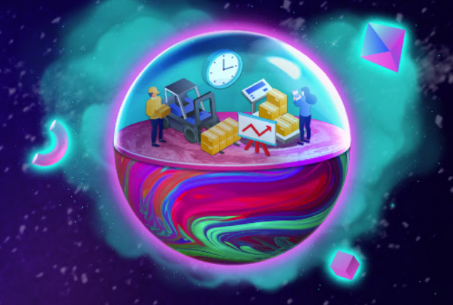
Logística de Negocios